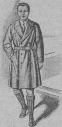
Preciosos modelos en trincheras para Señora, Caballero y Niño, de una, dos y tres telas. Confeccionadas y a la medida.