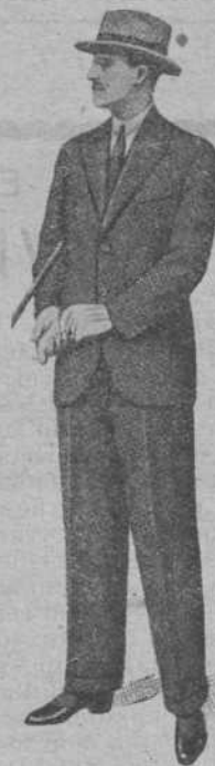
TRAJE LANA para hombre, desde 32 ptas. " niño " 10 "

Trajes driles para hombre y niño - Trajes para mecánicos Pantalones en todos los tamaños, de lana, driles y panas Guardapolvos, etc, etc, por muy poco dinero