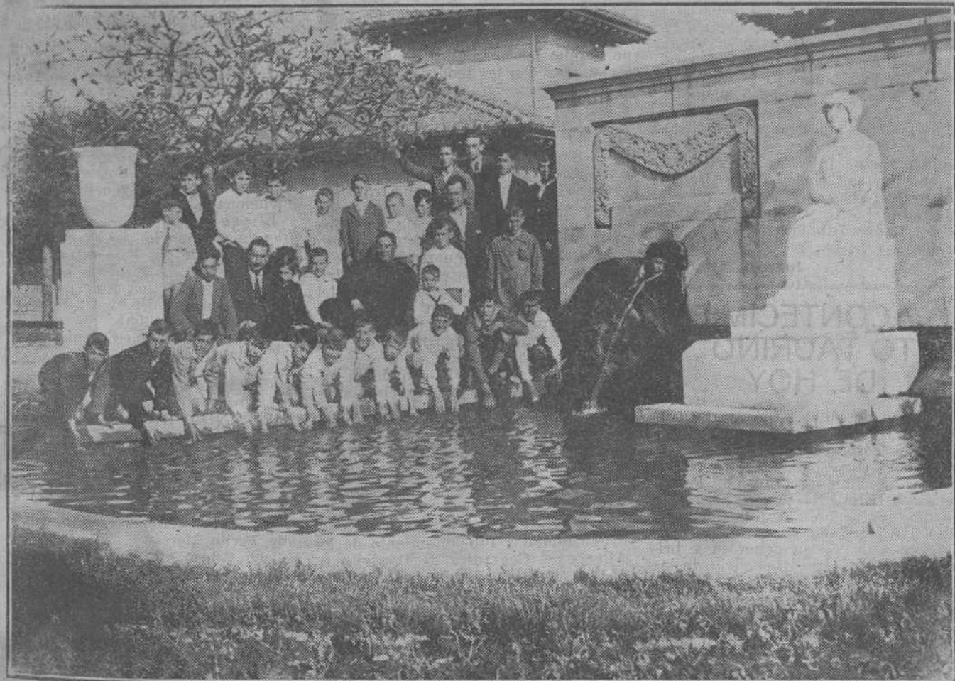
DE UNA EXCURSION.—Los alumnos de la Escuela nacional de Entrambasaguas visitaron en su reciente excursión los lugares interesantes de la ciudad, apareciendo en la fotografía ante la estatua de Concha Espina.

Nuestro cordial saludo de bienvenida a los señores de Camprubí, cuyos patrióticos entusiasmos alabamos y hacemos nuestros.