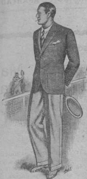
Americana y pantalón «Oxford» Gran novedad - Desde 29 pesetas.

y es garantía de Corte Elegante, Esmerada Confección y Positivo resultado