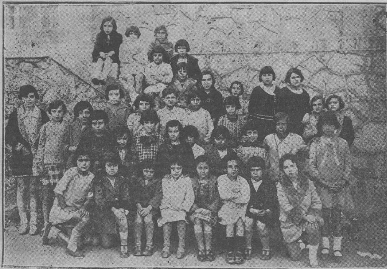
DE LA VIDA ESCOLAR SANTA NDERINA.—Niñas que reciben instrucción en la Escuela de Puertochico.