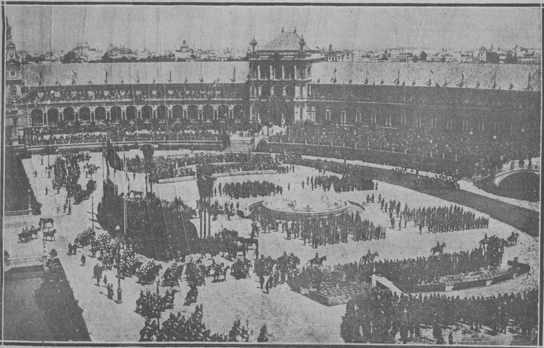
Fantástico aspecto que ofrecía la plaza de España de la Exposición de Sevilla, durante la ceremonia inaugural del certámen Iberoamericano.