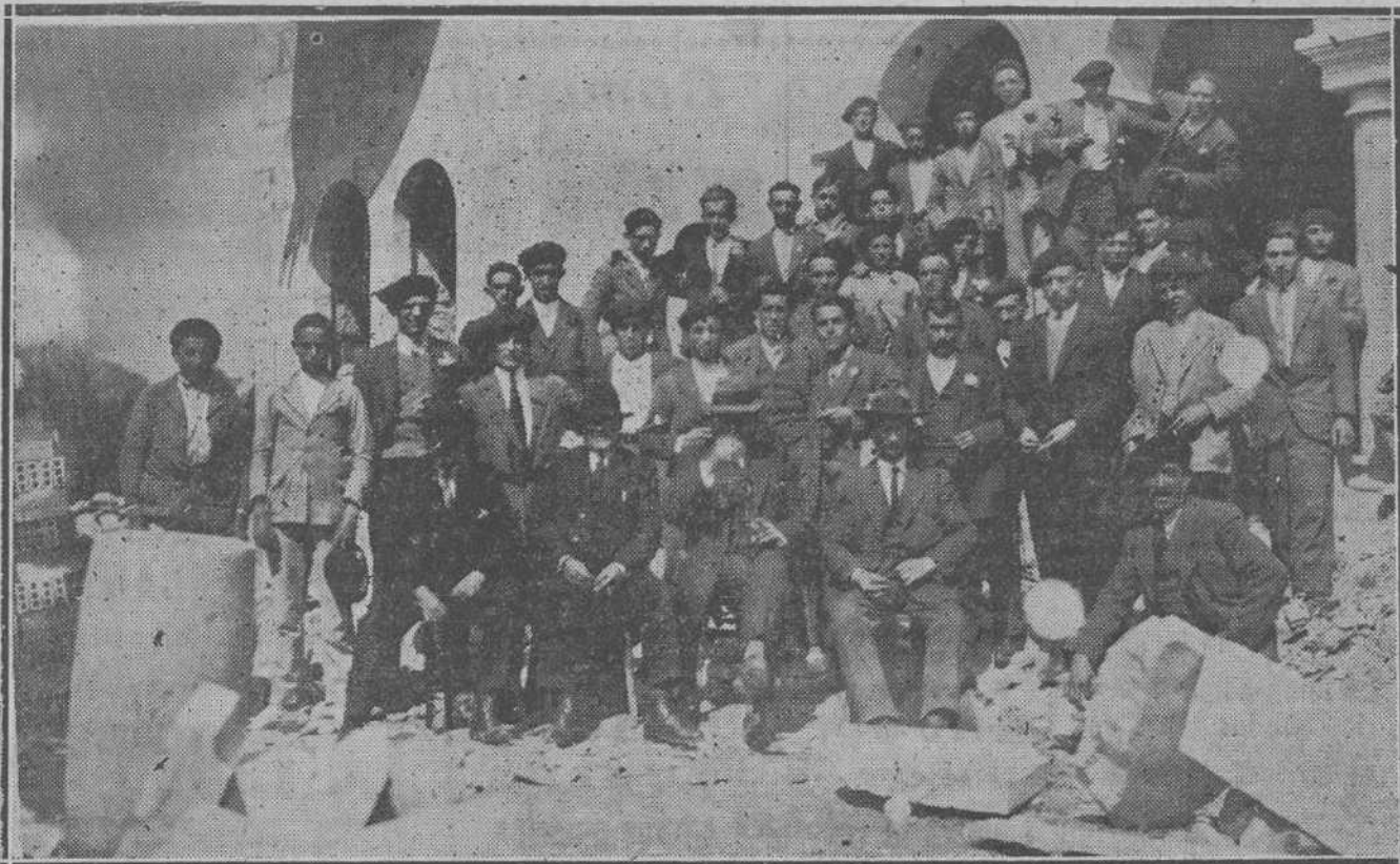
MEJORAS EN LA PROVINCIA.—Obreros que trabajan en las obras de los nuevos edificios destinados a Ayuntamiento y Mercado, de Santa María de Cayón, que fueron obsequiados, por el alcalde, con una comida con motivo de la colocación de los tejados.