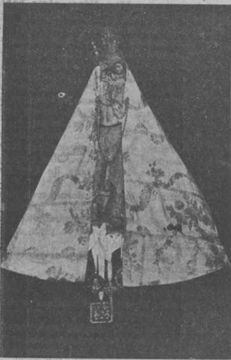
«La Santuca», diminuta imagen, ídolo de los lebaniegos, que desde hace más de quinientos años baja en procesión desde Aniezo al exmonasterio de Santo Toribio y recorre veintiseis kilómetros.

La llamamos con cariño la «Santuca» por su diminuto tamaño. Esta imagen es de alabastro y está ya bastante deteriorada. Su altura es