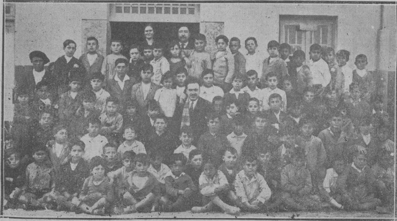
DE LA VIDA ESCOLAR SANTA NDERINA.—Alumnos y profesores de las escuelas municipales de Cueto.

Dada la valía del conferenciante, la gran importancia del tema escogido y el interés que ha despertado este cursillo teológico, es de suponer que el magnífico salón de actos del Instituto presente un aspecto tan brillante como el de las conferencias anteriores.