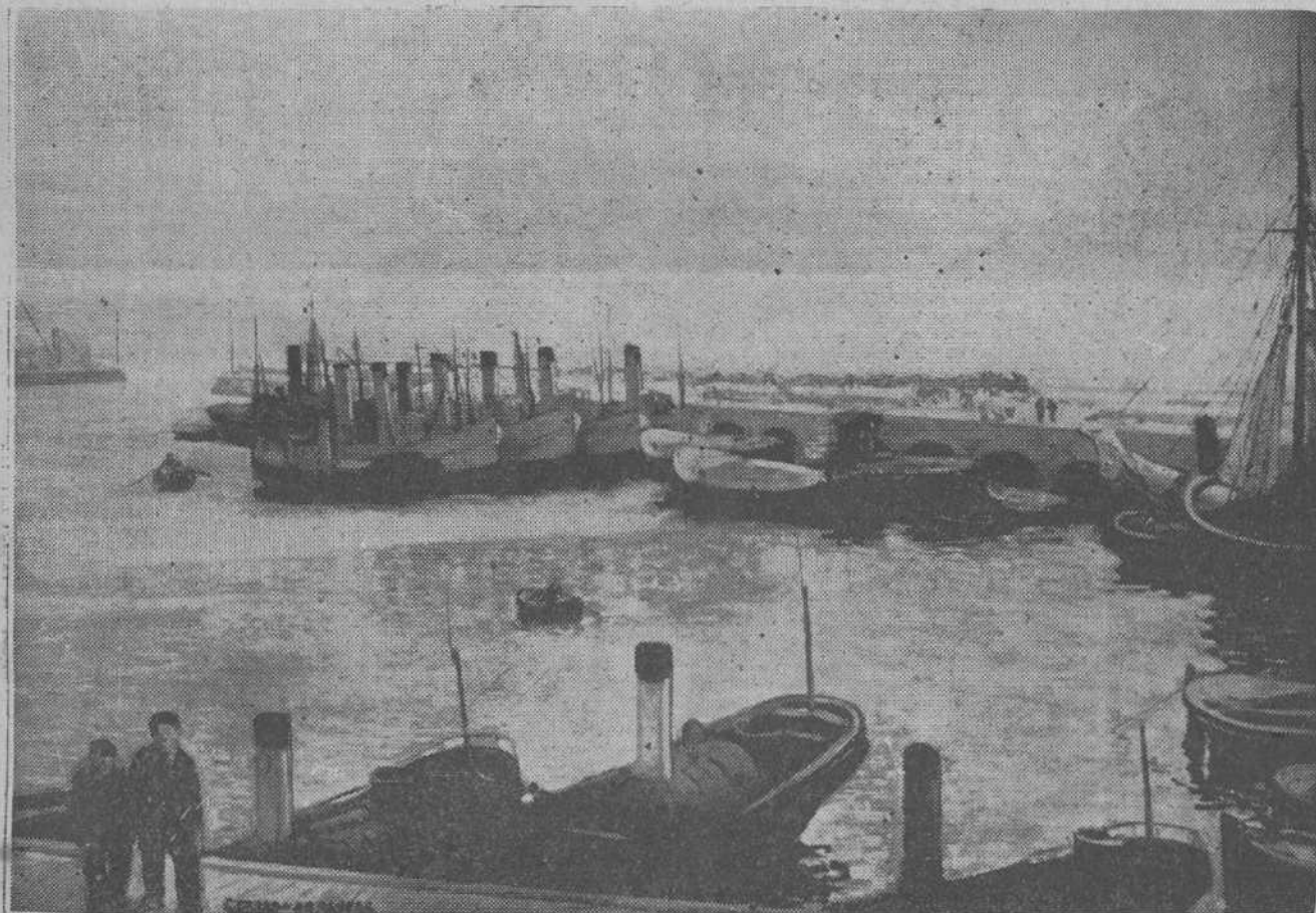
"La dársena de Puertochico", cuadro que figura en la exposición que el notable pintor Gerardo Alvear celebra en el Ateneo de Santander.

Puertochico tiene sus horas, todas llenas de sabor local y todas bellas; pero unas más bellas que las otras. Por ejemplo, la media tarde, cuando el sol como un coche que ha perdido sus frenos, baja patinando por la carretera celeste. Entonces una luz única, que es caldo de oro, pone en las aguas profundas del puerto un esmalte metálico. Entonces, desde los huecos de las casas suntuosas se ve el cuadro de magia que no ven los vecinos de las casas suntuosas de ningún otro puerto. En el estuche de la dársena estallan los colores chillones de las chimeneas de los barcos: las chimeneas anaranjadas y amarillas, las chimeneas verdes y rojas... Los veleros viejos, que ya sólo se hallan en estas dársenas, azzan la gracia de sus palos, perfumados y bruñidos con sal de mar. En la gran rampa, las motoras y