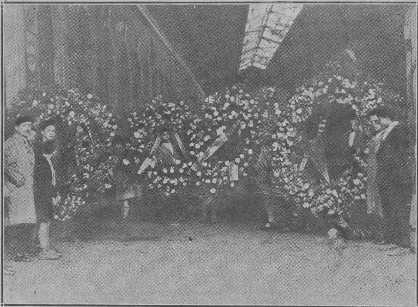
AYER, EN LA ESTACION DEL NORTE.—Las coronas que distintas entidades de Santander depositarán ante el cadáver de Su Majestad la Reina doña Cristina, dispuestas para ser colocadas en el tren especial en que salieron para Madrid las autoridades y otras representaciones de la ciudad.