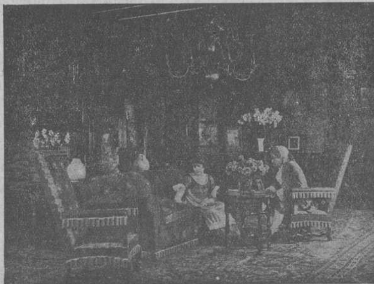
Una escena de la gran película española PEPE-HILLO, admirable realización del conocido director montañés, PEPE BUCHS, e interpretada por la famosa artista española MARIÁ CABALLE.

Se dice que también vendrá a Irún, con objeto de asistir al solemne acto de la consagración de nuestro queridísimo párroco, el señor ministro de Justicia y Cultos, don Galo Ponte, y una representación de S. M. el Rey, quien no se sabe si la delegará en el capitán general o en el gobernador militar.