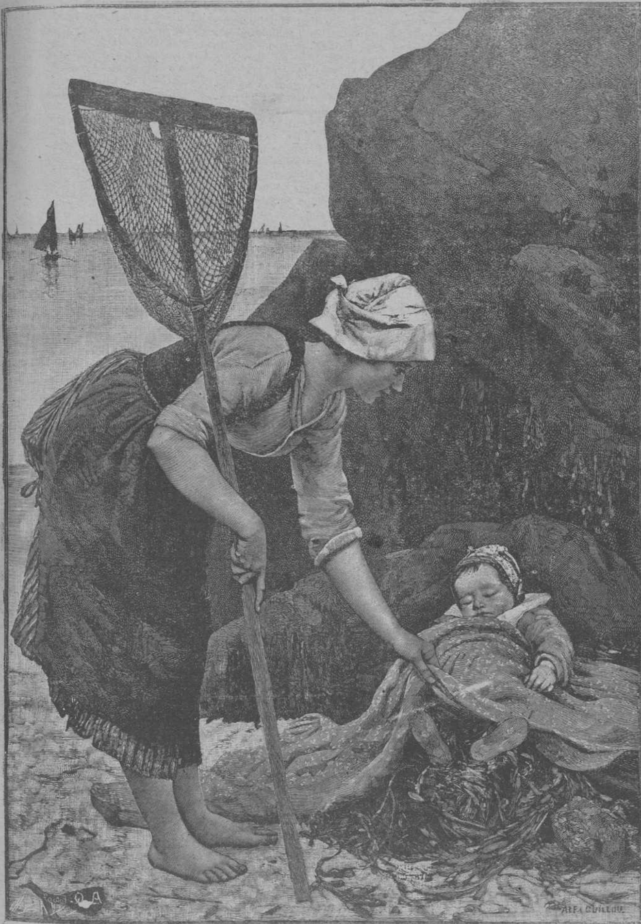
LA CUNA DEL MARINERO, cuadro de Alfredo Guillou.—Muestra típica del arte de caballete y estudio del siglo XIX, es el lienzo que reproducimos. Este arte, con el que acabó el impresionismo, que fué audazmente a buscar la luz en el natural, entre todos sus defectos, tenía un encanto, o lo tiene hoy, en que le vemos a distancia con nostalgia retrospectiva: el encanto de su candor. Todas las alegorías de este arte son de una simplicidad infantil. Así, la cuna de este niño pescador, sobre la playa y al pie de una roca. Así, esta pescadora, concebida un poco a la manera de las pastoras de Wateau. Arte eminentemente amable y decorativo, aquel arte hacía muy bien en los salones románticos en que se leía a Lamartine y a Zorrilla. Arte también para ilustración de los viejos museos de familia que tanto agrada hojear hoy encuadernados. De lo más característico de tal arte, es el cuadro de Alfredo Guillou que reproducimos.

Pero hasta en la pobreza hay grados y matices. Hay pobres de po-