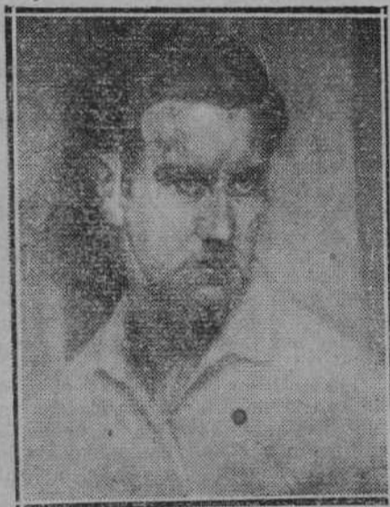
Un óleo de Ruiz Ceballos.

sión que acabamos de expresar, consideramos seguro que Alvear, no solo excelentísimo pintor, sino también buen catador de obras ajenas, podrá