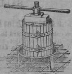
Prensas para uva y manzana desde 50' 7.

MECANOGRAFIA. — Enseñanza método al tacto, copias a máquina, precios económicos. «La Ideal». San Francisco, 31.