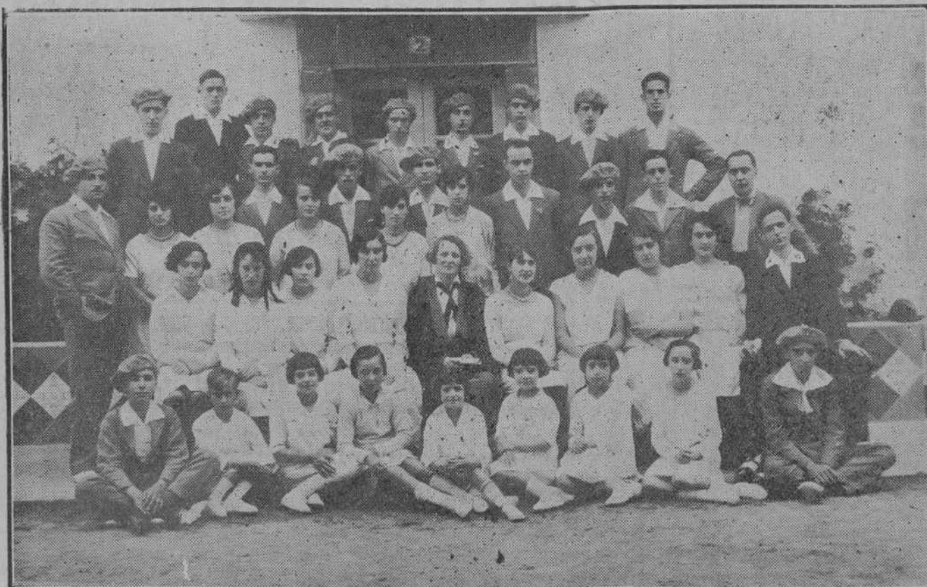
El orfeón "Voces Cantabras", de Cabezón de la Sal, que en breve dará allí interesante audiciones, esperadas con gran expectación.

Advertimos una vez más a cuantos tengan necesidad de dirigirse a este periódico, que el no mencionar el apartado 62 puede ocasionar retrasos en la recepción de la correspondencia.