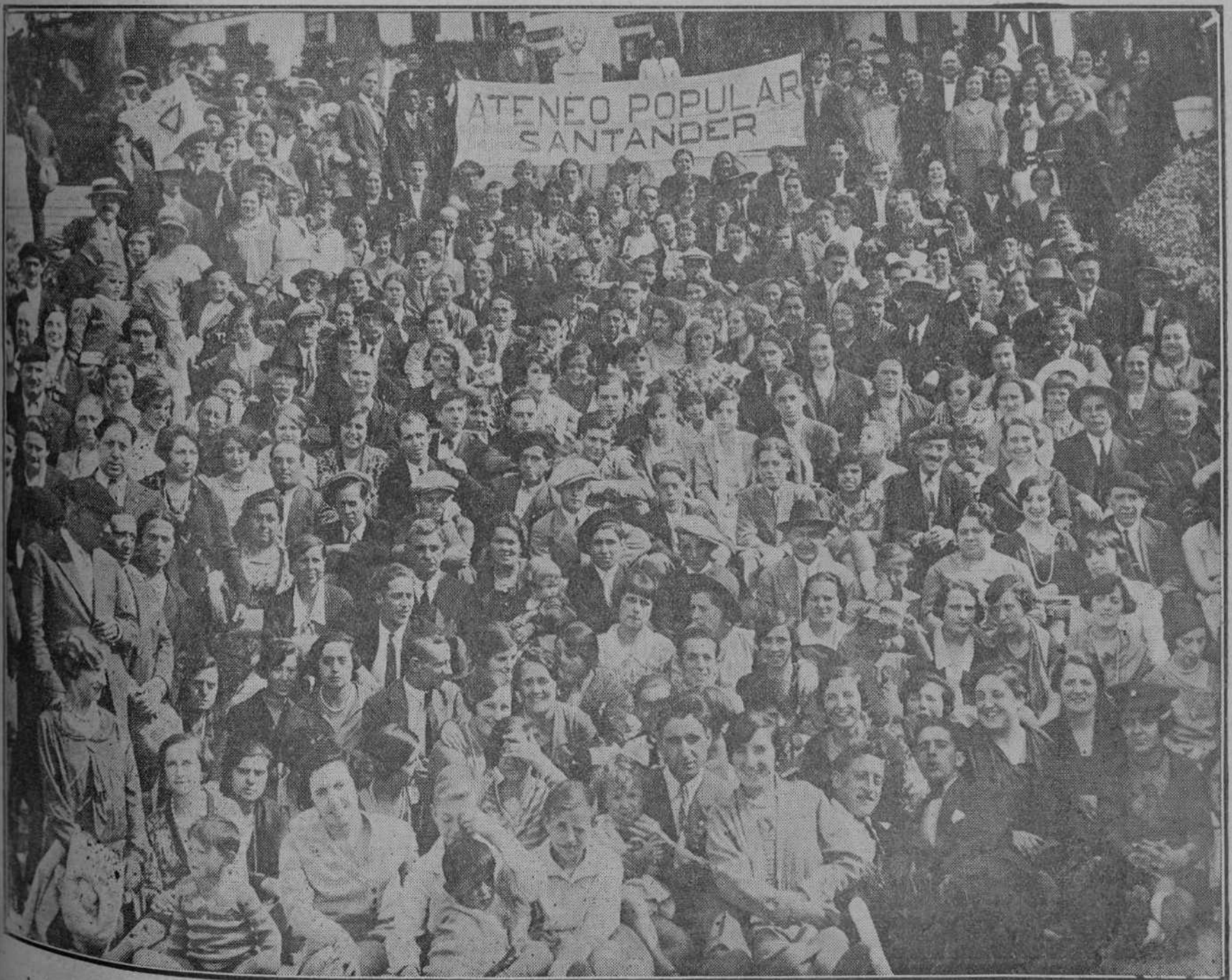
domingo se verificó una animadísima jira a Pedrosa organizada por el Ateneo Popular. He aquí a los excursionistas en la escalera de acceso al Sanatorio.

El cariño de amigos y el fervor de para la clase imitar a los maestros de Potes se excedieran en el elogio y en la recompensa. Nosotros agradecemos hondamente su adhesión, más meritoria porque nunca fué solicitada, y sólo nos resta agregar que el cargo es lo de menos en el orden de nuestra apreciación. Nunca aspiramos a puesto alguno de relieve en la vida societaria. Sin compromiso alguno hemos defendido los intereses docentes