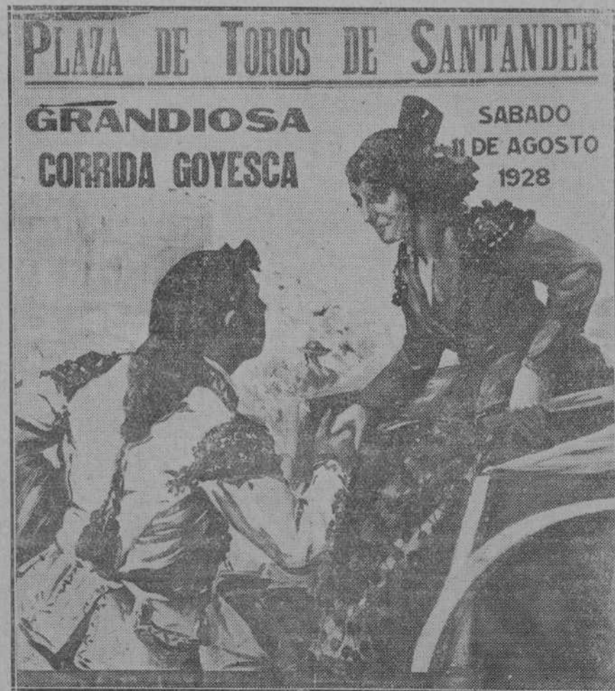
EL CARTEL DE LA CORRIDA DE ESTA TARDE.

Secretario de la Comisaría Sanitaria Especialista en piel y secretas Méndez Núñez 7, segunda, derecha