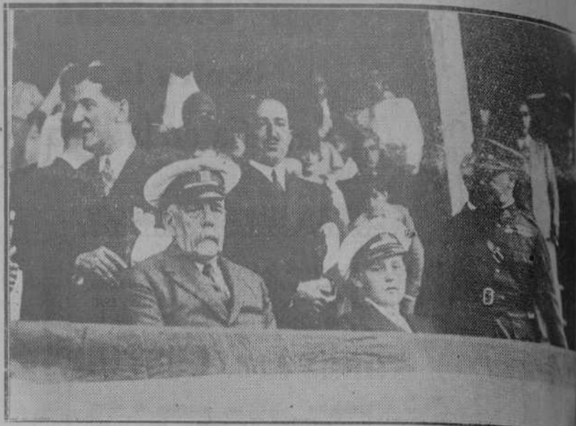
El infante D. Gonzalo en la tribuna de los Campos de Sport, presenciando el partido entre un equipo de la dotación del "Príncipe Alfonso" y una selección del regimiento de Valencia.