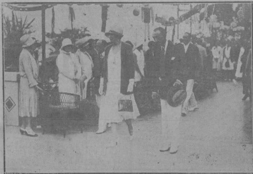
Majestad la Reina, entrando en el local de la Real Sociedad de...