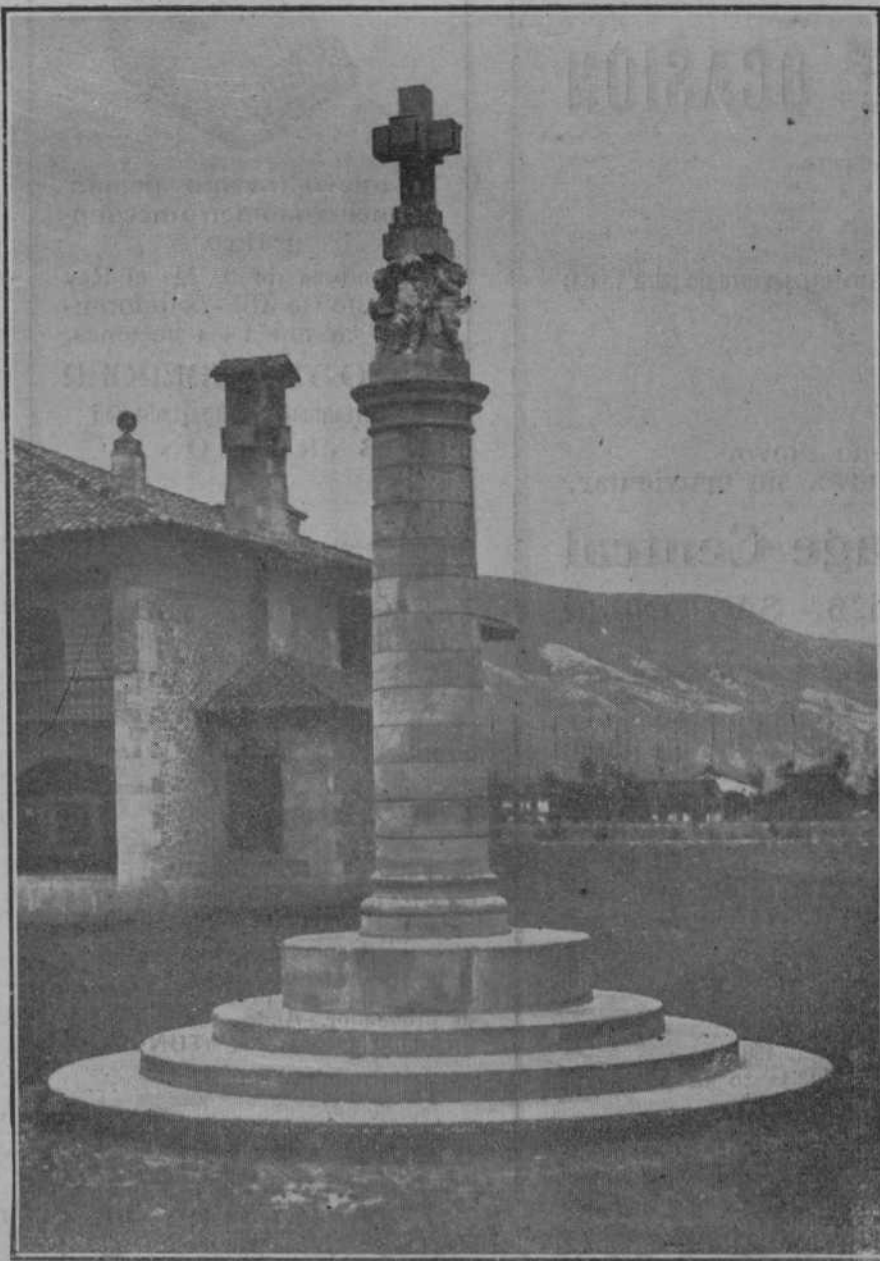
Este sencillo monumento de severa traza, obra del arquitecto don Mariano Lastra, y que se inaugura el sábado, ha sido alzado en Los Corrales de Buena, como gratitud del pueblo hacia la obra de alto valor social iniciada por don José María de Quijano y felizmente continuada por su esposa, la ilustre condesa de las Forjas de Buena.

El Ateneo Popular supo corresponder, como siempre, atento a las pupilaciones artísticas que se desarrollan en nuestra patria.