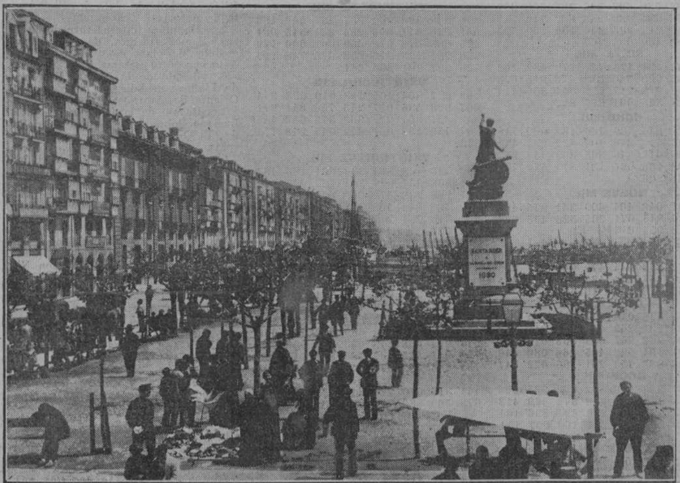
ESTAMPAS DEL SANTANDER ANTIGUO.—La plaza de Velarde cuando de las pescaderías, albergadas bajo toldos de sucia lona, ofrecían sabrosa mercancía al aire libre. Los puestos de pescado y la estatua del héroe desahuciados dejaron libre el solar donde hoy se alza el bello Palacio de Comunicaciones.