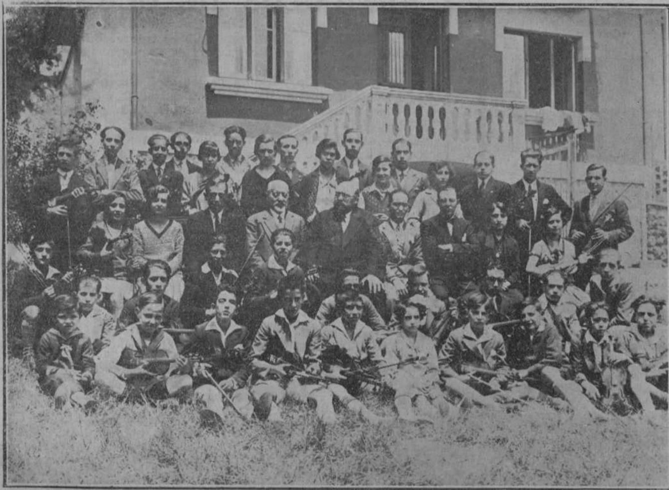
Actores de la entidad «Coral de Santander», que actualmente celebran brillantemente los