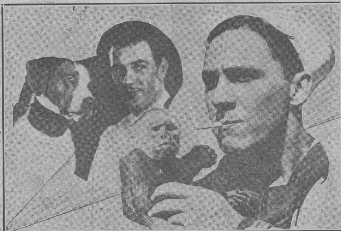
El mico predilecto de George O'Brien encendiendo el cigarrillo del joven actor en una escena de la película de Fox «Tenorios del Mar».—Gary Cooper, con su perro predilecto, es ahora uno de los ases juveniles de Paramount.