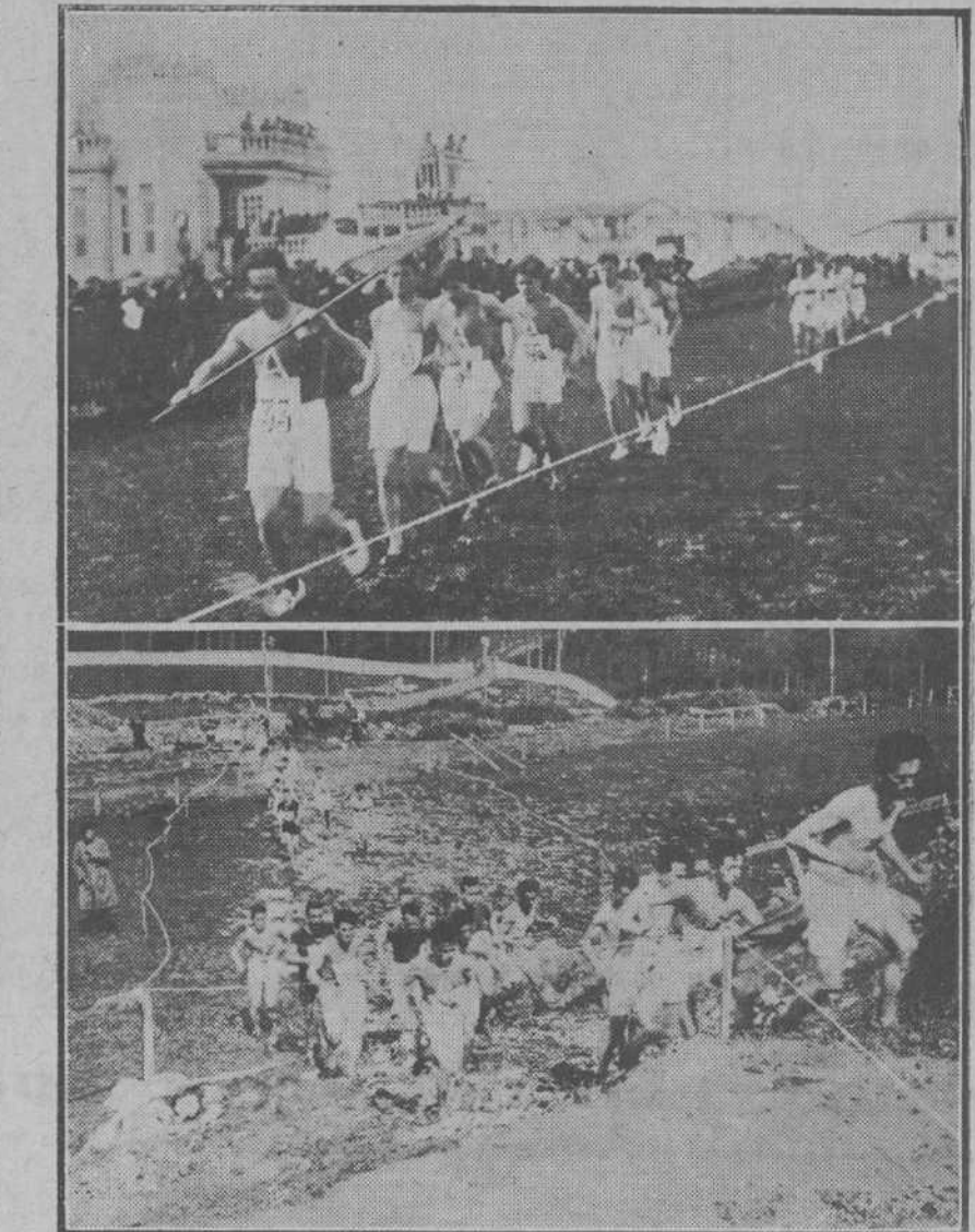
DEL "CROSS" NACIONAL DEL DOMINGO.—Arriba: Asturias desfila olímpicamente, seguida de Andalucía y Vizcaya.—Abajo: Interesantísimo momento, de verdadero "cross", en que los corredores trepan por un pequeño talud, validos de una rampa.

¿Qué es el libro de Luis Bello, titulado "Viaje por las escuelas de España"? Sencillamente la crónica de su cruzada nobilísima. Este de ahora es el tercer volumen de la serie y abraza las andanzas del autor por Extremadura. Si no supiéramos todos que Luis Bello es un escritor de mérito las páginas de estos libros lo confirmarían ple-