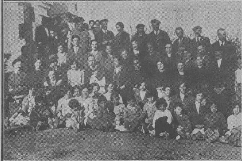
Nueva escuela de Moncallán, inaugurada solemnemente el último domingo.—Grupo de asistentes a la inauguración.