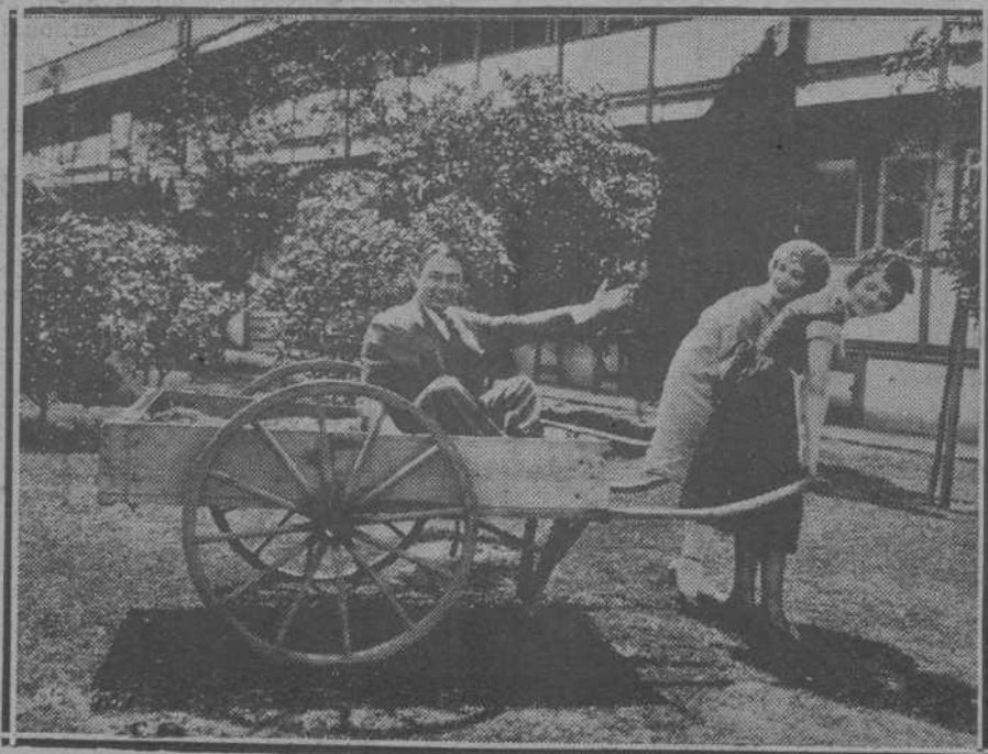
En Hollywood, los artistas cinematográficos recurren a los más pintorescos pasatiempos en las horas de descanso. He aquí a un hombre que sería completamente feliz si no tuviera la cabeza tan separada del "tronco".