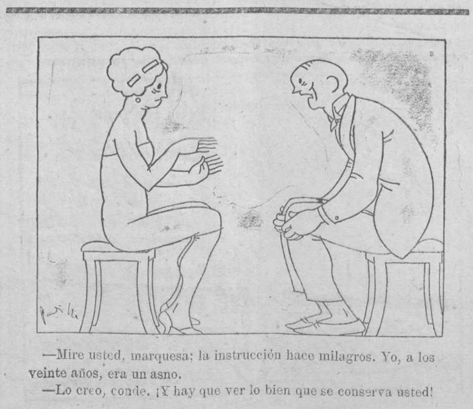
—Mire usted, marquesa; la instrucción hace milagros. Yo, a los veinte años, era un asno. —Lo creo, conde. ¡Y hay que ver lo bien que se conserva usted!