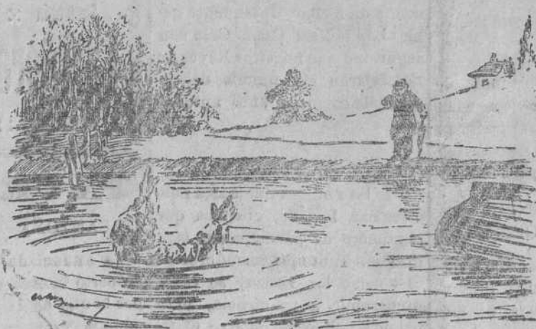
—Sálveme y le daré toda mi fortuna. —¿Qué, si usted no tiene fortuna! ¡Si me han dicho que está usted con el agua al cuello!

Estarán expuestos los días 15, 16 y 17 del actual, de diez a una y de cuatro a seis, y aunque modestos, como obra de niños, seguramente han de ser del agrado del público, como lo han sido otros años.