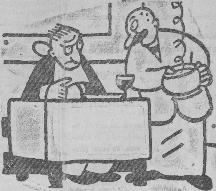
—Pero hombre, que está usted metiendo los dedos en mi sopa. —No importa. Voy a lavarme ahora las manos.

El alcance luminoso en tiempo ordinario será de siete millas. La luz irá colocada sobre una torre de seis metros de altura, de sección cuadrada.