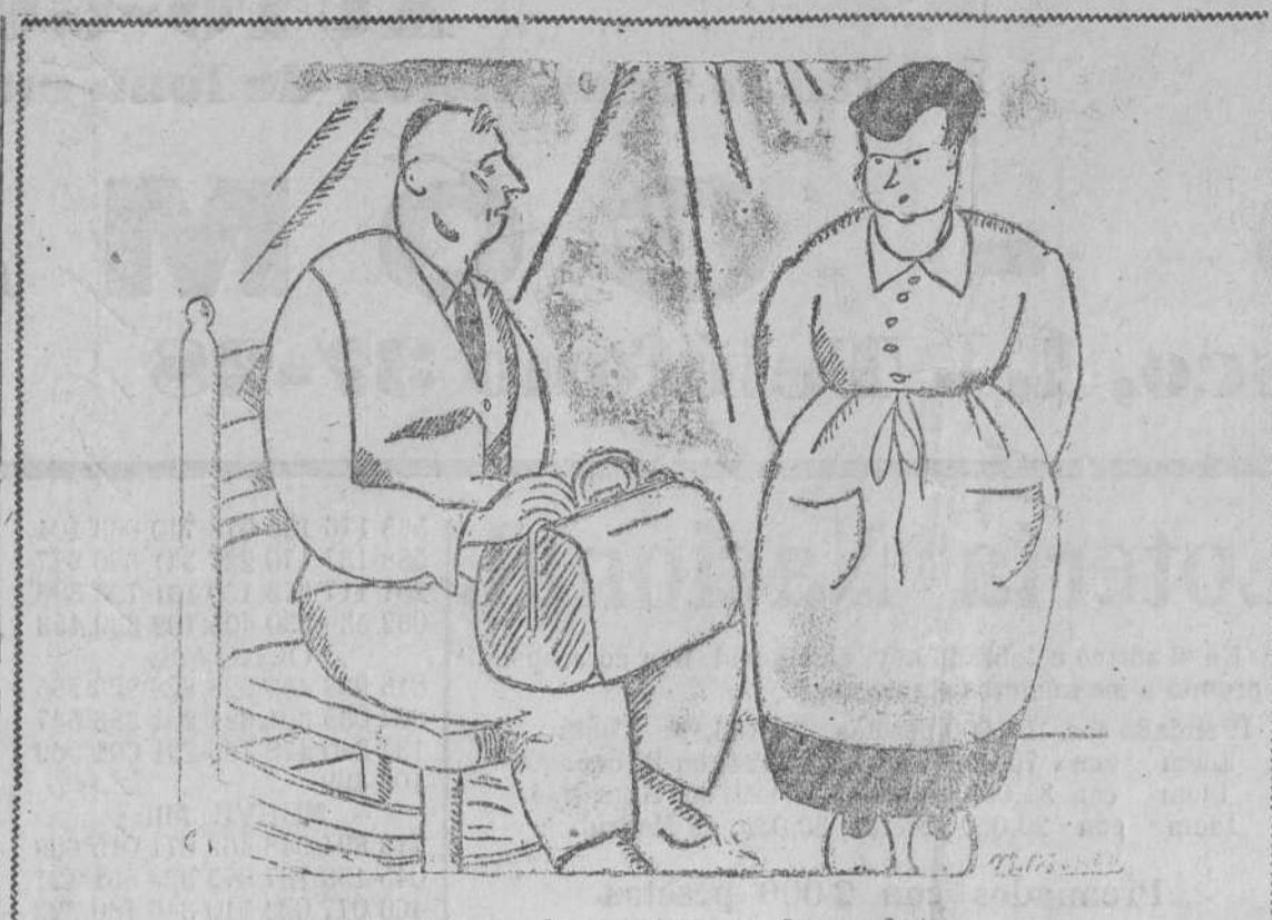
—Te pondré un par de mudas en la maleta, —Para qué, si no voy a estar fuera más que dos meses

«Este número ha sido revisado por la censura Actualidad santanderina.»