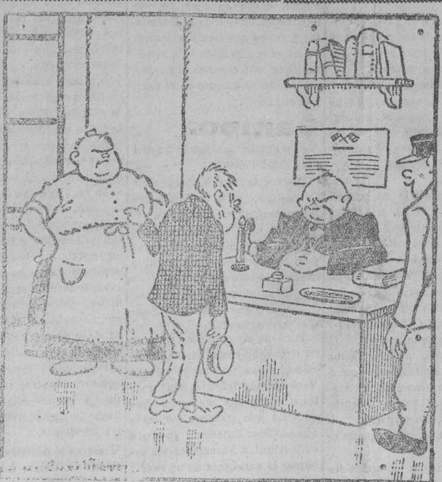
—Le acusan de que ha pegado usted a su mujer. Eso es una cobardía. —Señor Comisario, fíjese bien y reconozca que el pegar a una fiera es un acto de verdadero valor.

Dr. LLERANDI GARCIA ENFERMEDADES DEL ESTÓMAGO, HÍGADO E INTESTINOS. RAYOS X. MEDICINA GENERAL. Consulta de 9 a 1 y de 4 a 6. Calle del Peso, 9 Teléfonos 20-19 y 30-60