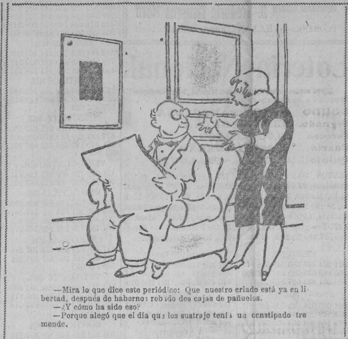
—Mira lo que dice este periódico: Que nuestro criado está ya en libertad, después de haberme robado dos cajas de pañuelos. —¿Y cómo ha sido eso? —Porque alegó que el día que los sustrajo tenía un constipado tremendo.

La «Gaceta» publicó un Real decreto de Gracia y Justicia disponiendo que, durante un plazo de tres meses, contando desde la inserción de esta disposición en la «Gaceta», en las capitales de provincia y en las localidades en que exista una prisión central, podrán constituirse, ratificar su funcionamiento o reorganizarse. Asociaciones de Patronatos de reclusos y liberados, cuya finalidad sea colaborar en la obra de reforma del delincuente, para readaptarlo a la vida honrada, dando así complemento a los efectos del régimen penitenciario con una tutela y una ayuda que aparte a los que delinquieron del peligro de la reincidencia.