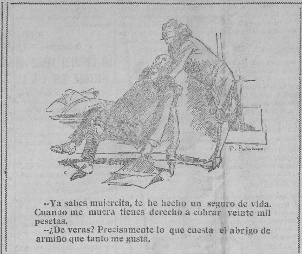
—Ya sabes mujercita, te he hecho un seguro de vida. Cuando me muera tienes derecho a cobrar veinte mil pesetas.

En el Instituto General y Técnico, cuartel de María Cristina y varios centros de enseñanza, también se celebró con gran brillantez la fiesta del Libro.