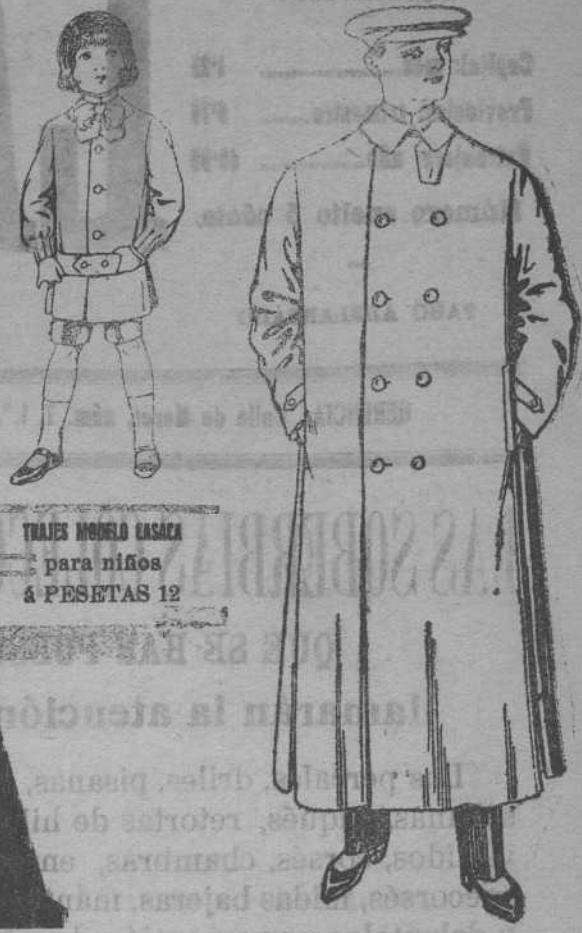
TRAJES MODERNA para niños á PESETAS 12