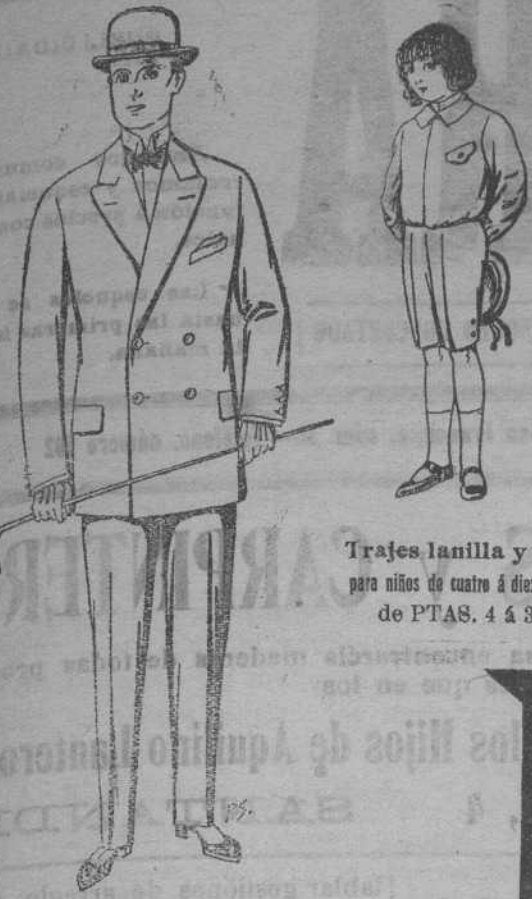
Trajes lanilla y dril, para niños de cuatro á diez años, de PTAS. 4 á 35