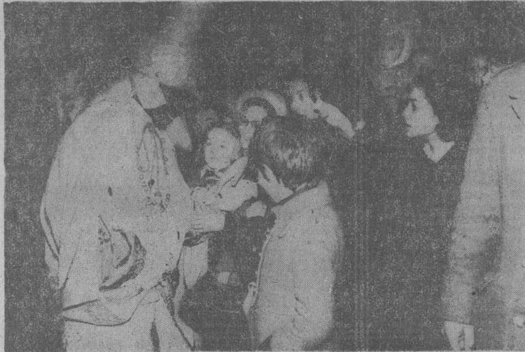
La población infantil de Santander se aglomeró en nuestras calles para presenciar el desfile del cortejo real de los Magos de Oriente que durante toda la noche han visitado Centros benéficos y numerosas viviendas para dejar sus juguetes a miles de niños. (Información en undécima página)