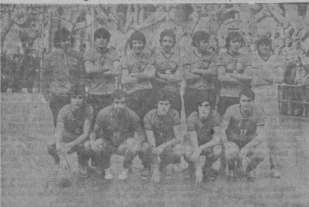
Equipo de Salesianos, vencedor del «Trofeo de Navidad», ganando al Rayo Vallecano.

Una gran jornada balonmanística la celebrada ayer, domingo en la Plaza José Antonio, correspondiente a las finales del «Trofeo Navidad», organizado por la F. D. Rayo Vallecano, en la que no solamente se celebró la final, sino que se enfrentaron en sentido ordinal todos los equipos que han intervenido para dar una clasificación general a los mismos.