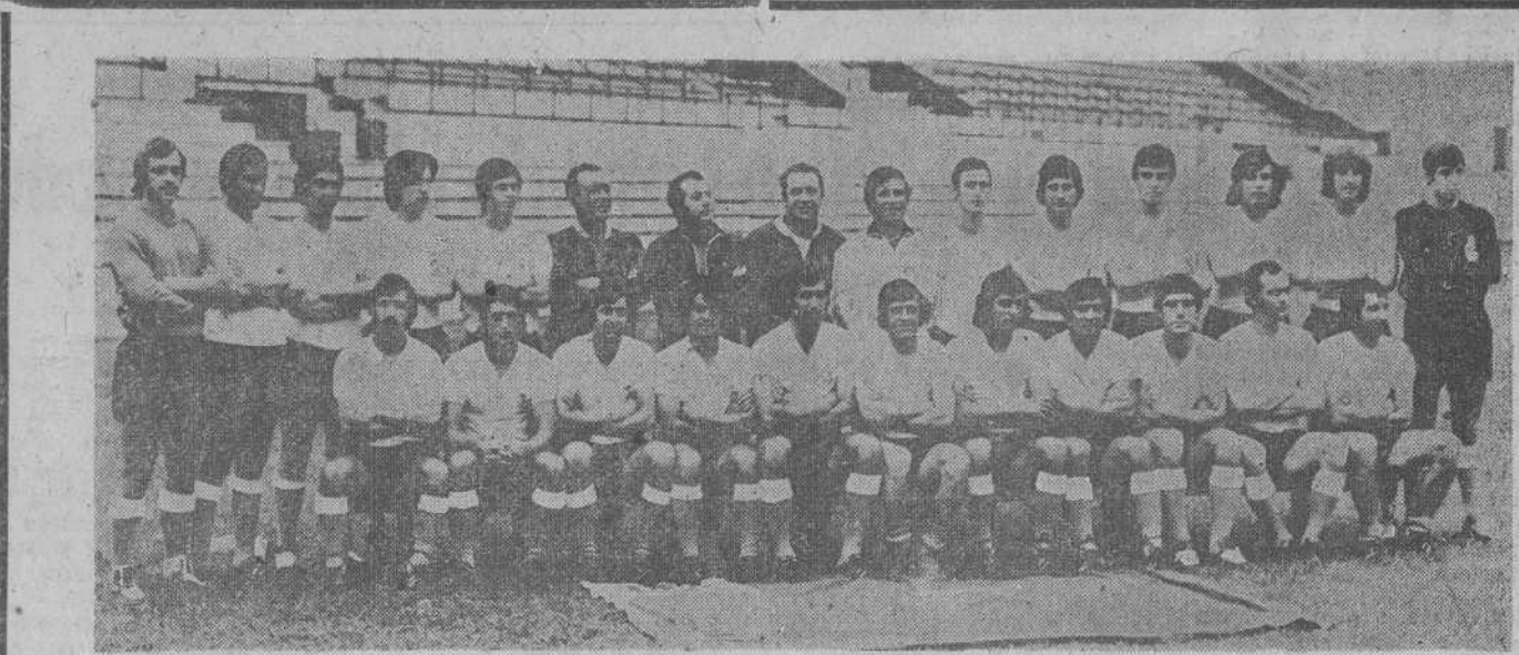
Por méritos propios, el Racing ocupa el segundo lugar de la clasificación. Méritos que, ayer, en «Santa Coloma» continuaron para lograr un meritorio punto positivo, tras realizar un formidable encuentro defensivo.