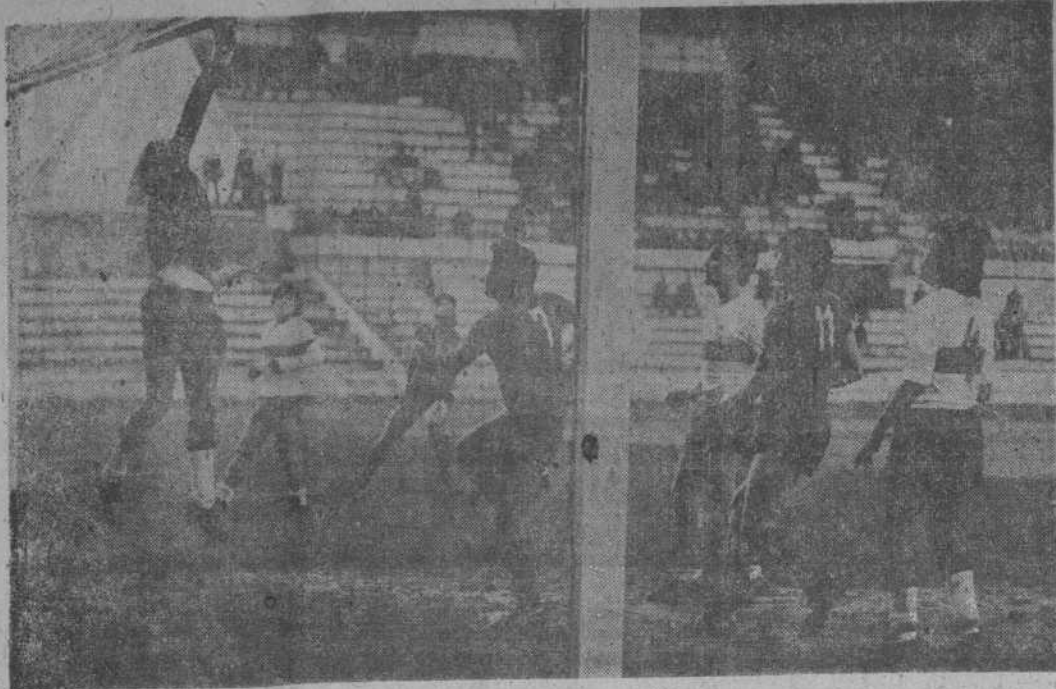
El meta asturiano despeja a córner en uno de los avances de los atacantes santanderinos.