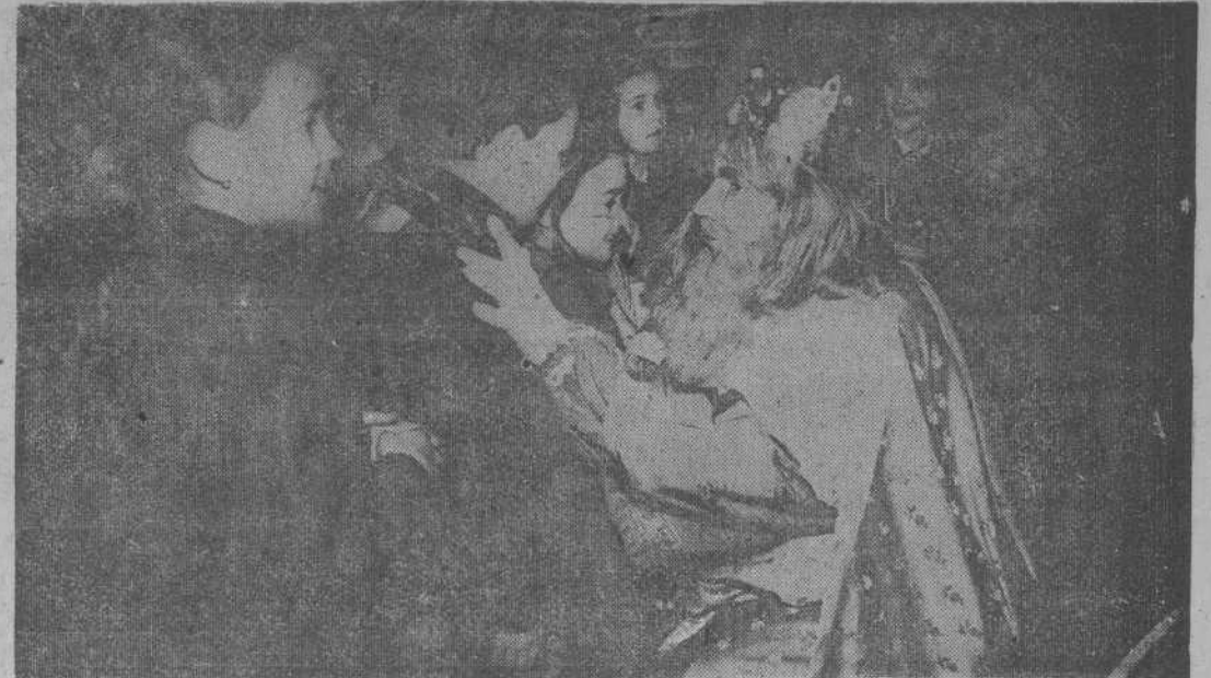
El Rey Gaspar corresponde al entusiasmo de sus pequeños amigos de Santander.

Posteriormente los Magos iniciaron su recorrido por la capital con objeto de seguir el reparto de obsequios, tarea que concluyeron muy avanzada la madrugada.