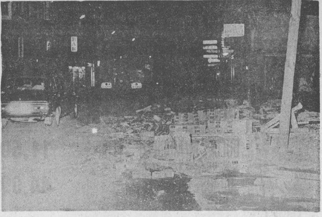
Así quedó la tapia que a consecuencia del huracanado viento se cayó el sábado último en Torrelavega.

FABRICA DE ALFOMBRAS LIQUIDA EN COLABORACION CON SERAFIN TORRELAVEGA GRANDES OFERTAS EN TODAS NUESTRAS SECCIONES EXPOSICION DE LAVADORAS «NEWPOL» ¡VISITENOS!