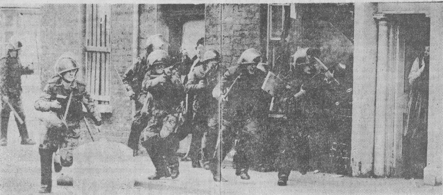
La lucha en el Ulster: Fuerzas británicas durante los sangrientos incidentes que se registraron en Londonderry y en los que murieron trece personas.

Se adoptaron extraordinarias precauciones SILENCIOSA MANIFESTACION DE 30.000 PERSONAS