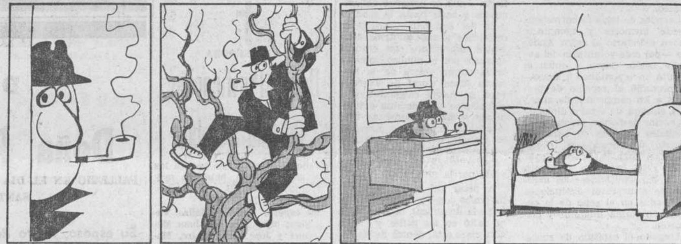
El detective vigila... ..acecha... ..indaga... ..espía...