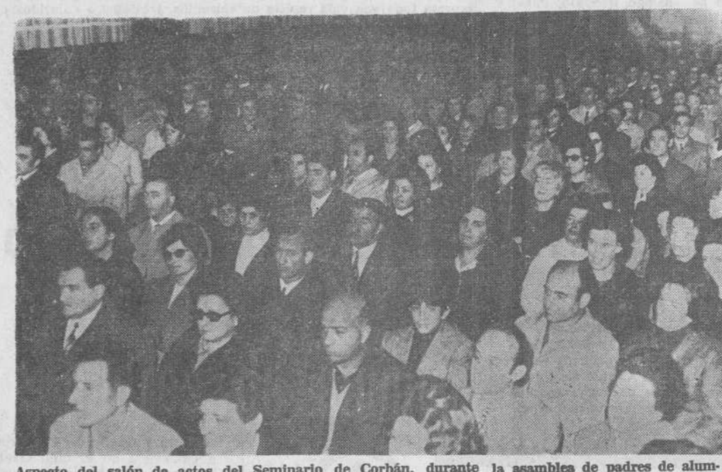
Aspecto del salón de actos del Seminario de Corbán, durante la asamblea de padres de alumnos, celebrada ayer.—(Foto MAZO).

de trabajo y responsabilidad, no porque así el día de mañana alcancen una vida más cómoda, una posición social mejor, un medio de ganar mucho dinero,