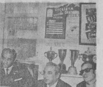
Presidencia de la Asamblea de la Federación Cantabra de Ciclismo...

Al final, la Federación invitó a todos los presentes a un lunch.