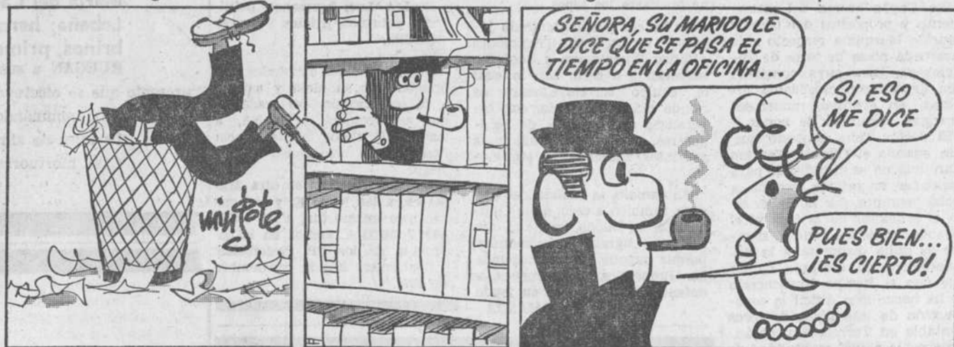
...escudriña... ..observa... ..y, por último, informa.