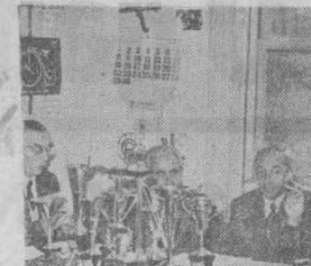
Presidencia de la Asamblea de la Federación Cantabra de Ciclismo...