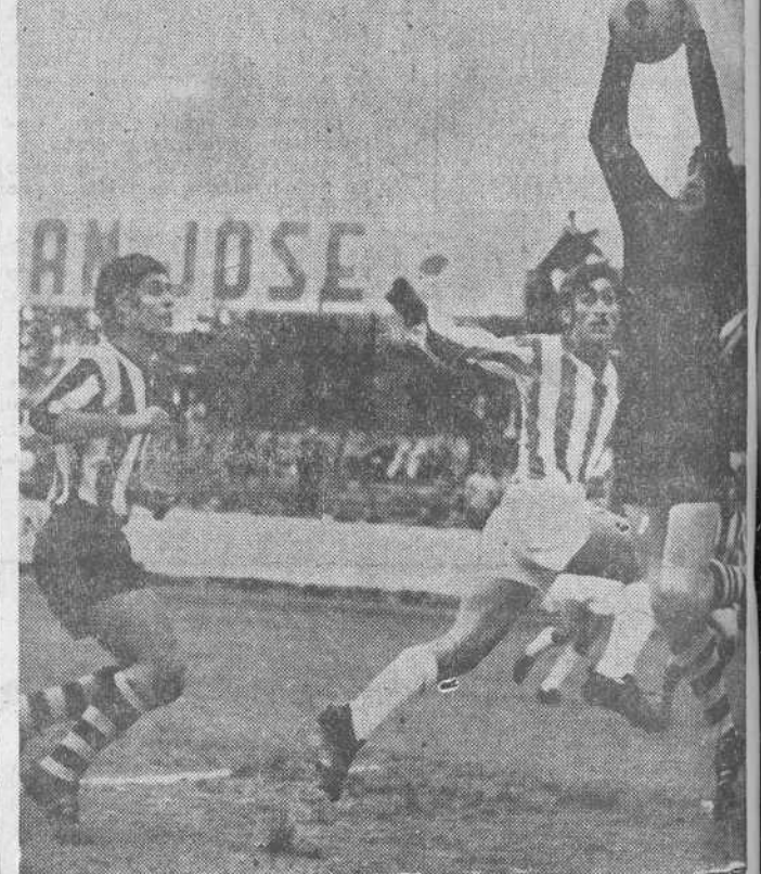
Una parada del portero del Basconia, acusado por el gimnasta Chente.—(Foto LOBETO).

Leonesa, Tenerife, Valladolid, Mestalla y Jerez ascienden a Segunda División PROMOCIONAN ORENSE, PALENCIA, GERONA Y CARTAGENA Madrid. (Afil).—Finalizado con la jornada de ayer el Campeonato, el balance es el siguiente: Ascienden automáticamente a Primera División: Betis, Burgos, Coruña y Córdoba. Descienden a Tercera División: Moscardó, Calvo Sotelo y Onteniente. Promocionarán por la permanencia en Segunda División: Langreo, Villarreal, Logroñés y Oviedo. GRUPO PRIMERO Asciende a Segunda: Leonesa. Promociona: Orense. Descienden a Regional: Toluca, Vetusta y La Bañeza. GRUPO SEGUNDO Asciende a Segunda: Tenerife y Valladolid. Promociona: Palencia. Descienden: Michellin, Carabanchel y Ejeda. GRUPO TERCERO Asciende a Segunda: Mestalla. Promociona: Gerona. Descienden: Al. Baleares, Paiporta y Mataró. GRUPO CUARTO Asciende a Segunda: Jerez. Promociona: Cartagena. Descienden: Imperial, R. Granada y Llerenense.