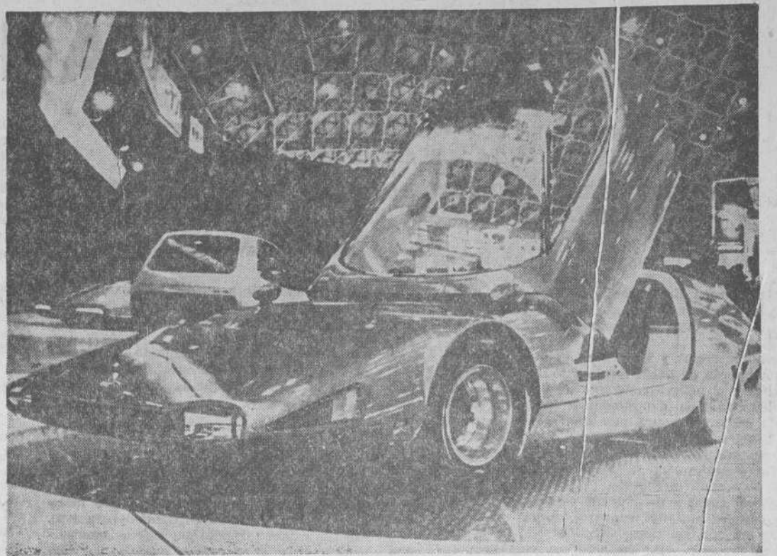
Los coches, motocicletas, bicicletas y camiones japoneses, antes considerados poco dignos de confianza, invaden ahora todos los mercados. En la fotografía, un nuevo modelo japonés del coche eléctrico.

Japón acaba de conseguir lo que se describe como «el mayor contrato para la exportación de equipo para acerías» conseguido jamás por una firma japonesa en lo que el valor de la operación se refiere. El pedido lo ha realizado la República de Sudáfrica.