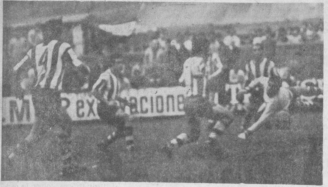
He aquí el segundo gol marcado por el Barreda al Lugo y que sentenció el partido.