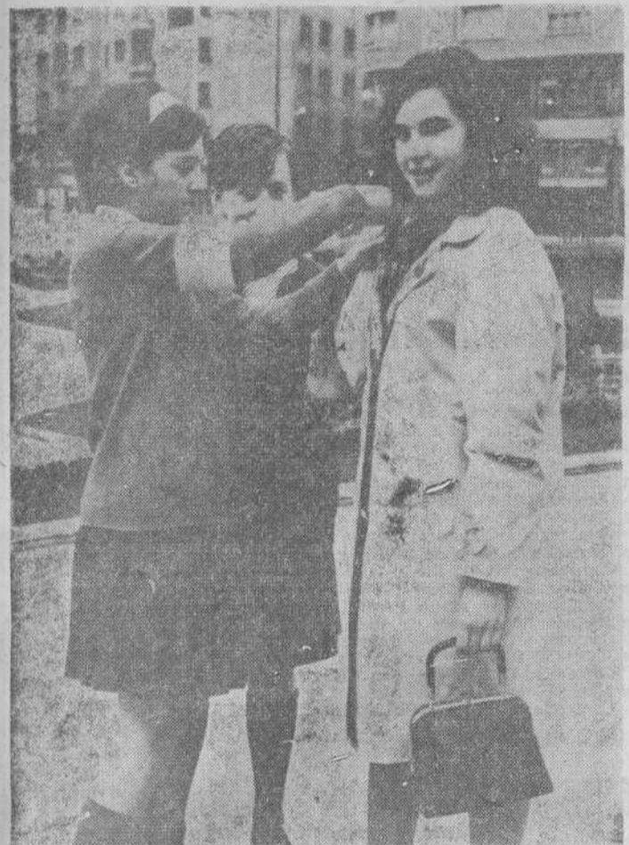
Ayer se celebró en nuestra capital la cuestación popular a beneficio de la Obra Misionera de la Santa Infancia. Numerosas postales "asaltaron" al público y obtuvieron una considerable recaudación. En la foto de Bustamante, dos pequeñas abordan a una bella muchacha.