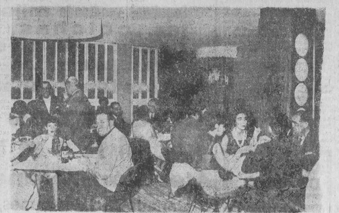
ES UN BELLO Y AMABLE RINCÓN DE LA ELEGANTE CAFETERÍA-MARISQUERÍA "LEALTAD", DE LA QUE EL PÚBLICO HACE LOS MÁS CALUROSOS ELOGIOS.

La planta es la marisquería fresca del día, a precios asequibles. La segunda planta de la Cafetería-Marisquería "Lealtad" está formada por un precioso bar americano, en el que no se sabe qué admirar más, si su elegancia y buen gusto o la originalidad y el "bonito" que puede allí encontrar el cliente. Comodísimos sillones, taburetes forrados en rica tela y goma esponjada, teléfonos con transmisor y paredes tapizadas que evitan todos los ruidos, así como una perfecta instalación de aire acondicionado en verano y de buena calefacción en invierno, hacen de este bar americano un precioso rincón donde las horas transcurren sin sentir en un ambiente enteramente agradable. El acceso a esta planta, así como al salón de té y televisión, que ocupa la superior, se realiza mediante una maravillosa y artística escalera de maracó, especialmente diseñada para que las señoras puedan ascender cómodamente, siendo rematada al final con una hermosa iluminación que proyecta una fuerte luz natural a todo el recinto. En esta planta están instalados los salones de té y televisión, así como una perfecta instalación de aire acondicionado en verano y de buena calefacción en invierno, hacen de este bar americano un precioso rincón donde las horas transcurren sin sentir en un ambiente enteramente agradable.