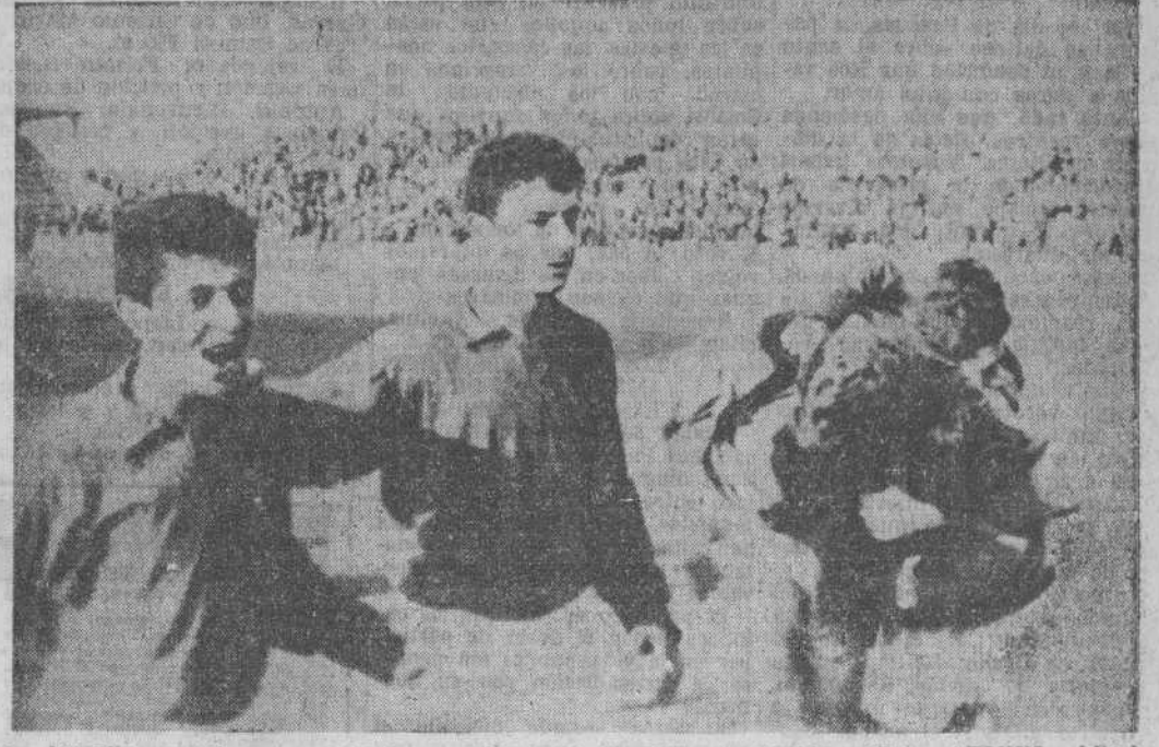
Los juveniles murcianos muestran su alegría al terminar el partido.

Había ambiente para este partido de vuelta de los cuartos de final del Campeonato de España entre selecciones regionales entre los juveniles de Cantabria y de Murcia. Tanto que el Sardinero registró uno de los más impresionantes llenos de su historia, comparable únicamente cuando en las mejores épocas del Racing nos visitaba un Madrid, un Barcelona o un Atlético de Bilbao, por no citar más que a tres de los equipos más taquilleros. El espectáculo que ofrecían los graderíos repletos de entusiastas aficionados, decepcionados luego, era impresionante y para nosotros uno de los aspectos más interesantes que ha ofrecido esta segunda confrontación entre montañeses y murcianos. La razón de este lleno tenía su raíz en el recuerdo del partido que los cántabros habían realizado frente a los castellanos, en el empate conseguido en La Condomina y en la casi seguridad que se tenía de que iban a clasificarse en una tarde de apoteosis para las semifinales. Los equipos se alinearon así: Salamanca: Menéndez; Olavarría, Jaspé, Hormaza; Hernández, Kaito; Alonso, Pineda, Laureica, Neme y Saro. Santander: Larzábal; Pallás, Gómez, Pedrito; Navarro, Goñi; Crispi, Montesinos, Abel, Baisells y Suco.