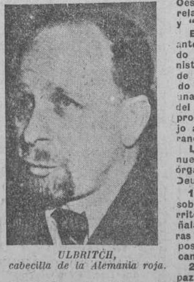
Ulbricht, jefe de la Alemania roja.

Berlin. (Efe).—Walter Ulbricht, dirigente comunista de la Alemania oriental, en un discurso hecho público hoy propuso la celebración de negociaciones entre los alemanes del Este y del Oeste, destinadas a mejorar las relaciones entre los dos Estados y "al mantenimiento de la paz". En el discurso, pronunciado ante el Comité central del partido de unidad socialista (comunista), Ulbricht propuso un plan de cinco puntos, que es calificado por los observadores como una versión, menos detallada, del "plan de paz alemán", ya propuesto por el dirigente socialista alemán durante el pasado verano. Los principales puntos del nuevo plan, según los publica el órgano del partido "Neues Deutschland", son: 1. Acuerdo para respetar la soberanía de cada uno de los territorios de los dos Estados, señalando claramente las fronteras entre ellos y para impedir la posibilidad de que se produzcan conflictos fronterizos. 2. Negociar un tratado de paz. 3. Acordar no producir ni armar a sus Ejércitos con armas atómicas. 4. Apoyar la conclusión de un pacto de no agresión entre las potencias del pacto de Varsovia de la OTAN. 5. Iniciar negociaciones destinadas a formar una confederación.