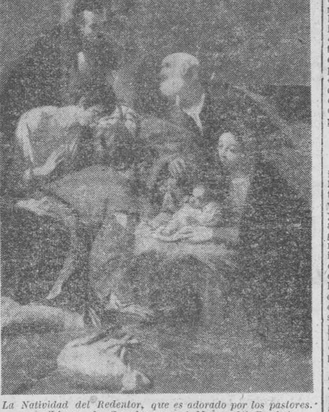
La Natividad del Redentor, que es adorado por los pastores. (Lienzo de Cavedone, en el Museo del Prado.)

Nada se sabe de los treinta y ocho tripulantes del barco, que había cambiado su ruta para auxiliar a otro navío en peligro