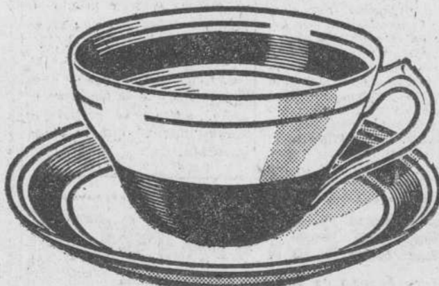
Servicio de café con leche (Su valor Ptas. 60.-)

Mediante la entrega de 4 etiquetas NESCAFÉ y 10.- Ptas. en efectivo.