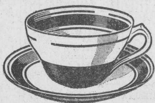
Servicio de café (Su valor Ptas. 40.-)

SOCIEDAD NESTLÉ EN SANTANDER - AVDA. CALVO SOTELO, 19