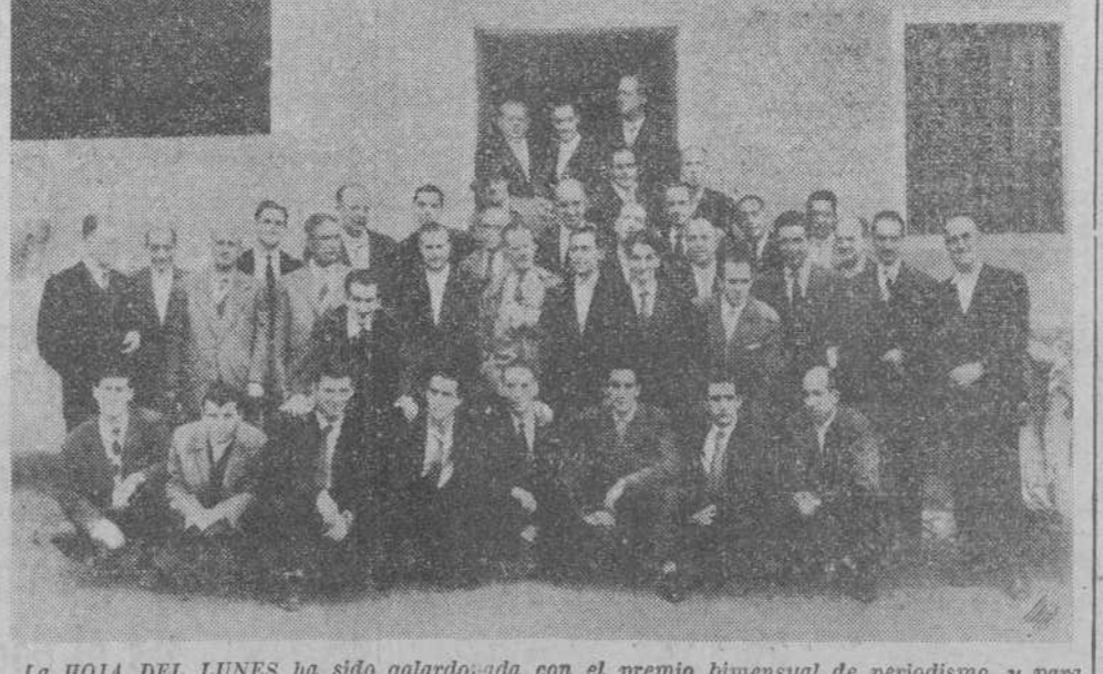
La HOJA DEL LUNES ha sido galardonada con el premio bimensual de periodismo, y para celebrar este gran galardón, todos los componentes de Redacción, Administración y Taller se reunieron fraternalmente en el restaurante "La Vizcaina", de la Albergía, donde fueron espléndidamente atendidos con una comida de las mejores de esta antigua y acrisolada Casa.