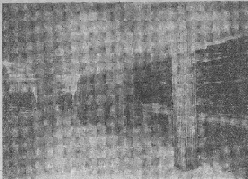
Un aspecto del interior del nuevo establecimiento "Pañerías Sumillera", abierto al público en la calle de Bécodo, número 1.

Mañana, martes, quedarán abiertas al público las acreditadas y conocidas PAÑERÍAS SUMILLERA, en su nuevo local de la calle de Bécodo, número 1, esquina a la Cuesta del Hospital.