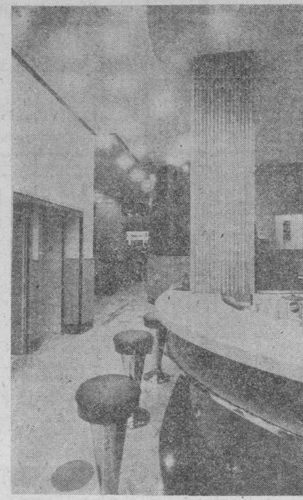
Una bella perspectiva de la Cafetería "Vienna", con entrada por la calle de Ruiz Tagle.

Añadimos a estas líneas que el proyecto de esta cafetería ha sido ejecutado por el arquitecto municipal de Torrelavega, don Federico Cabrillo, a cuyos órdenes ha laborado el apareador don Gerardo Cavada, y digamos también que tanto la MANTEQUERIA como la PASTELERIA VIENA corren parejas con el buen gusto en su instalación, a la CAFETERIA, bellamente decorada de asuntos de caza y de caballos y elegantes zócalos de tabillera de las más ricas maderas. La inauguración de estos primeros sirvió para que los numerosos invitados al acto felicitasen, con la mayor efusión, a los señores De Diestro, que han sabido llevar a la realidad el deseo de su querida ciudad, de tener un establecimiento de CAFETERIA, CONFETERIA y MANTEQUERIA que nada tiene que envidiar a los mejores de Madrid, Barcelona y Santander. A esta felicitación queremos unir la nuestra más sincera, como montañeses orgullosos, de tener paisanos capaces de llevar a cabo obras tan acabadas como ésta de que hemos hecho el justo mérito. Este encantado lugar de la bella ciudad del Besaya. VIDRIERA MONTANESA es la preferida por arquitectos y contratistas por las excelentes calidades de sus artículos, colocados en obras principales de Torrelavega y la provincia y en multitud de instalaciones industriales. VIDRIERA MONTANESA realiza también la colocación de cristales a domicilio, con rapidez y economía.