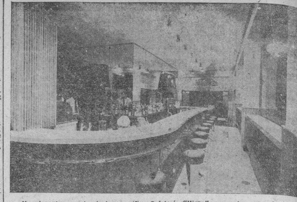
Un elegante aspecto de la magnífica Cafetería "Vienna", momentos antes de su brillante inauguración.

Documentaciones, pago de Derechos Reales, Plus Valía, certificaciones.