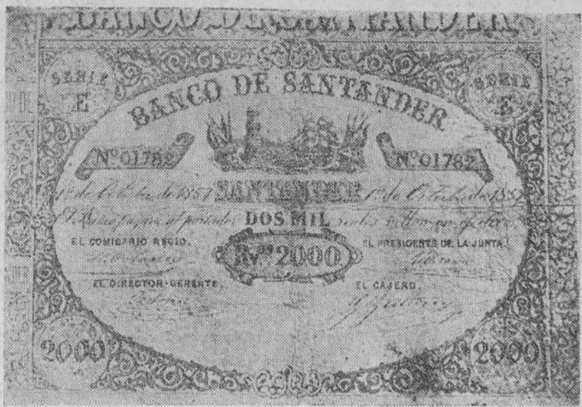
Así eran, en el lejano 1857, los billetes de 2.000 reales que emitía el Banco de Santander con toda clase de formalidades. Sobre cada ejemplar estampaban su firma directamente cada una de las personas que designaban los Estatutos fundacionales. La contabilización por pesetas no comenzó hasta 1881.

Evocación del Santander 1857, cuando exportábamos chacolí a la Habana y en nuestra provincia había dos mil hectáreas de viñedos. -- El Banco y la ciudad están en marcha