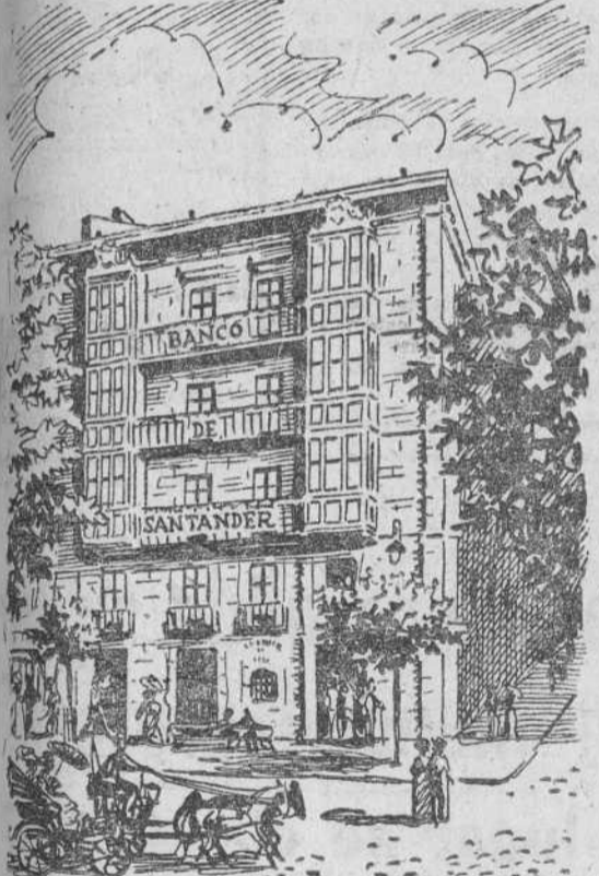
Los comienzos de este siglo el Banco de Santander estuvo instalado en la primera manzana del Paseo de Pereda. La estampa tiene todo el sabor de aquellos tiempos, bellos y patriarcales, en los que la actividad industrial avanzaba ya a pasos decididos. El "Gran Café del Boulevard" se instaló, años después, en esta misma casa que ocupó el Banco.

Desde aquel Santander —capital y provincia— que exportaba chacolí a la Habana y esto otro Santander 1957, hay algo más que una legua. Pero lo que hoy tenemos, y lo que hoy representa el Banco de Santander en la economía de la provincia y en la de toda España, no se hizo en un día ni de cualquier manera. Los esfuerzos de ayer y las inquietudes de una ciudad que quería estar siempre en vanguardia fueron el germen de lo que hoy se alcanza. Reconforta saber cómo en los viejos días cardinales que hoy se conmemoran —y exactamente en 1865—, don Marcelino S. de Santuola presentó en la exposición del Ateneo santanderino "el notabilísimo árbol llamado eucaliptus globulus, aclimatado por dicho señor con notable éxito en nuestra provincia". Pocos serán a juicio mío los que, ante la