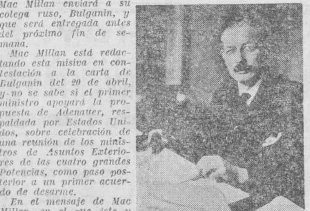
Harold Mac Millan.