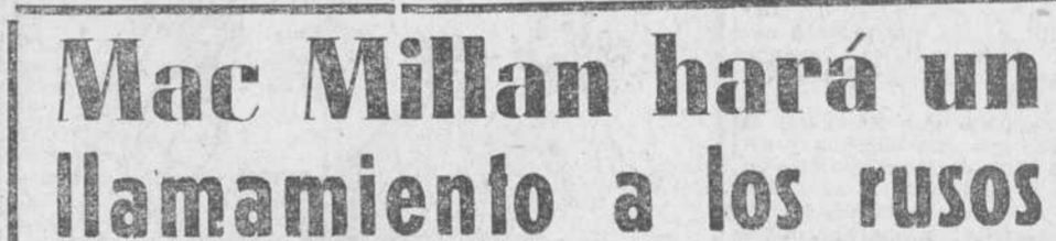
Harold Mac Millan.

El Sha se mostró muy interesado por los helicópteros franceses "Alouette" y "Djinn".