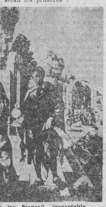
Durero, con su "Adoración de los Magos", inaceptable, pese a su perfección, para el gusto latino.

la broma, para entrar en el rango de universal pintor, dejar de ser pintor español de casta. Buen precio, por cierto. Volvamos, pues, a Murillo. Si un niño soñase una adoración de los pastores" la soñaría, poco más o menos, así, como estas de Murillo, tiene la perfección exigida por una mente candorosa y naturalista. Buena pintura, también. No es poco; pero nada más. Y por ello peritos y legos admiran lo que hay de vitalmente sugestivo en este otro sevillano que no dejó nunca de ser español. La lista sería interminable: Rivera, el vigoroso, el dueño de la materia plástica; ZURBARAN, el profundo, el honesto por excelencia; MAYNO, cuya "Adoración de los Reyes" en el Prado, tan cargada de excelencias no alcanza, sin embargo, la armonía total de las coloraciones. Citase aquí al Greco como el más espiritual y exaltado de todos los pintores, pero como uno de los más delicados y perfectos también. Su "Adoración de los pastores" en Santo Domingo el Antiguo de Toledo —mágica por la dramática "Iluminación"—, sus "Sagradas Familias", sus "Anunciations", son otros tantos poemas pictóricos en que su genio desplegó todo su íntimo lirismo y toda su incontestable sabiduría artística. Y téngase en cuenta que aunque citado el último de todos, "los últimos serán los primeros".