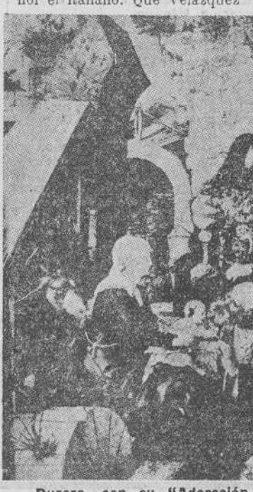
Durero, con su "Adoración de los Magos", inaceptable, pese a su perfección, para el gusto latino.

Un tópic: España es la tierra de la pintura religiosa. Otro: Murillo es el pintor de la religión en España. Los tópicos son verdades. Verdades que los tonos desvirtúan en fuerza de repetirlas rutinariamente; pero verdades al fin, y de las más ciertas. Velázquez pinta una "Adoración de los Reyes"; Murillo una "Adoración de los pastores", ambos en el Prado. Para quien habla de ser, andando los años, Velázquez, sus "reyes" bien pueden ser tomados por pastores. Murillo reitera el tema. Este cuadro está en el Vaticano. Nada nuevo ni distinto esencial. Velázquez, en su "Adoración" del Prado, es ya el mejor pintor español de casta — no hay por qué pensar aquí en el Greco —, pero, ¡ojó!, no uno de los mejores pintores del mundo todavía, todavía, sí, porque Velázquez, aun no conoce Italia, circunstancia decisiva en su obra. Dicen que a Velázquez no le gustó, en Roma, Rafael y que hasta hizo su frasecita: "No me place niente". Dudoso es que no placiese al espíritu el italiano. Que Velázquez