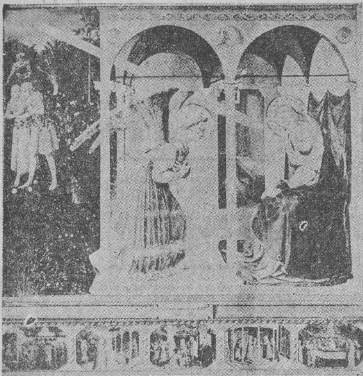
Fray Angélico, superior a la pintura misma, transido de místico arbo en su cristalina y rutilante "Anunciación", del Museo del Prado, y en cuantos temas acarió con sus pinceles.