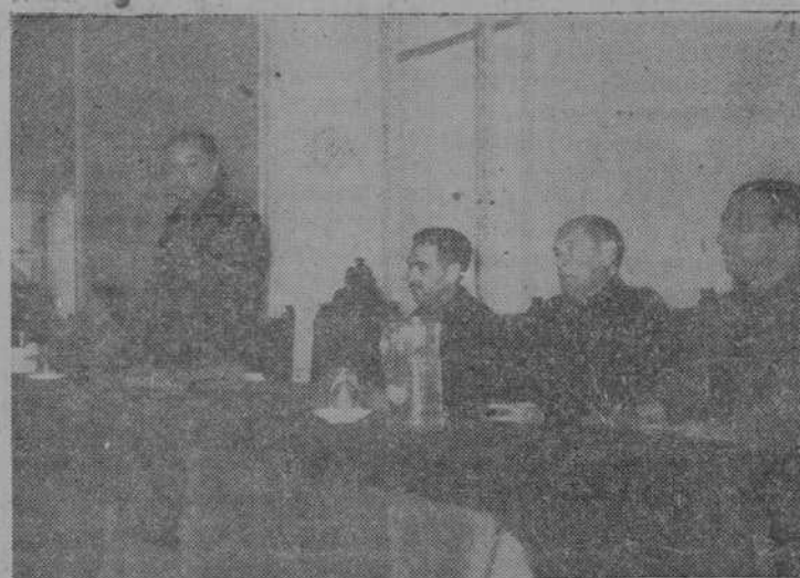
Presidencia del acto durante el discurso del jefe Provincial

Desde el 29 de octubre de 1933, en el que José Antonio Primo de Rivera lanzara a la Falange a la vida política de España, el Movimiento Nacionalista ha rendido ya casi —faltan tan solo muy pocos días— veinte años, fecundos en realizaciones y servicios, plenos de sentido revolucionario y ambiciosa y esperanzadora superación. Ha querido el mando nacional que esta etapa termine con la preparación de una nueva, en la que la Falange, enraizada ya, a pesar de tantas dificultades y en contra de los augurios malévolos de los aguafiestas y los enemigos de la Patria, en la esencia misma de la vida nacional, dé un nuevo impulso, vigoroso y definitivo, a la Revolución, pendiente aún en muchas de sus etapas más importantes. He aquí la razón por la que, no hace mucho tiempo aun en las Asambleas comarcales, y ahora en los Consejos provinciales, los hombres de la Falange, representados en sus mandos, se han movilizado para realizar un concienzudo estudio de todos los problemas que han de ser superados y de todas las metas a las que el Movimiento aspira llegar, para hacer de nuevo a España luz y guía del mundo. Las tareas del Consejo provincial de la Falange salmantina, que en los días pasados tuvo sus jornadas de trabajo, entusiasta e infatigable, culminaron ayer con la celebración de los actos de clausura.