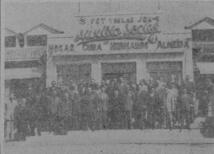
A la puerta del Hogar Cuna, durante la visita de los congresistas.

Las circunstancias actuales de limitación en el suministro de energía eléctrica, se hacen sentir en la confección del periódico, por lo que rogamos a nuestros lectores en general, sepan disculpar cualquier deficiencia en el mismo. Por idénticas causas, se impone una selección de originales y la limitación consiguiente, advirtiéndole a nuestros colaboradores y corresponsales en la provincia, la necesidad de reducir y extraer sus escritos, ya que de otra manera nos veríamos precisados a no publicarlos.