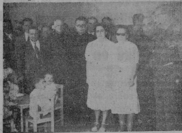
Los congresistas durante su visita al Jardín Maternal

(Viene de primera) El provincial del Movimiento, no pudo silenciar la íntima satisfacción que me ha producido el espíritu y tesón que los asambleístas y camaradas asistentes a este Congreso mostraron en el estudio de las distintas ponencias; el calor y el entusiasmo han sido las notas sobresalientes que presidieron nuestras sesiones a través de la ciudad y provincia.