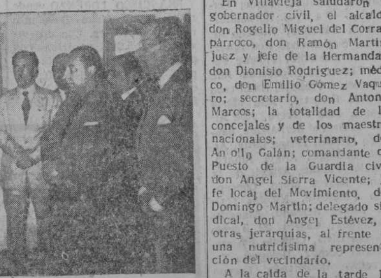
Bendición de uno de los edificios escolares de Villavieja de Yeltes.

Tokio.— El Cuartel General de las fuerzas aéreas de Extremo Oriente ha negado la acusación rusa, según la cual un avión de bombardeo B-50 que cayó al mar del Japón, el miércoles, hubiera violado el espacio aéreo ruso. (Efe.)