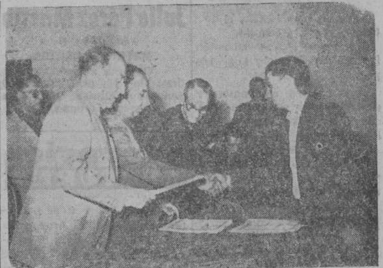
El gobernador civil y el presidente de la Diputación hacen entrega de los títulos de propiedad de huertos familiares, en Lumbrales

A lo largo de estos quince días, después de otros siete en que las Asambleas Comarcales de Falange Española llevaron a todas las regiones de la provincia las inquietudes para planear la acción futura, el jefe provincial del Movimiento ha inaugurado escuelas, casas para maestros, casas para médicos y centros primarios sanitarios, abastecimientos de aguas, fuentes públicas y huertos familiares a lo largo y ancho de la geografía palentina. Brincones, Villares de Yeltes, Villavieja de Yeltes, Lumbrales, Vitigudino, Audealvilla de la Ribera, Peña, Tardaguilla, Arcediano, Can' alpino, Aldeaseca de la Frontera, Anaya de Alba, Santiagu de la Puebla, Babilafuente, Cabrerizos, Sanchoello, Villanueva del Conde, Monforte de la Sierra, Agallas, Martiago, Robleda, Villar de Ciervo y Villar de la Yegua, cuentan con estas mejoras que son la iniciación de las otras muchas a realizar con decisión siguiendo los planes trazados en esas asambleas. Jornadas una y otras que han hecho del pasado mes de julio calendario completo en las realidades y esperanzas del engrandecimiento patrio.