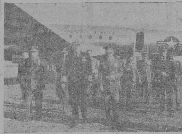
El almirante Radford, acompañado del jefe del Alto Estado Mayor, teniente general Vigón, y del subsecretario del Aire, general Sáez de Buruaga, a su llegada al aeropuerto de Barajas.