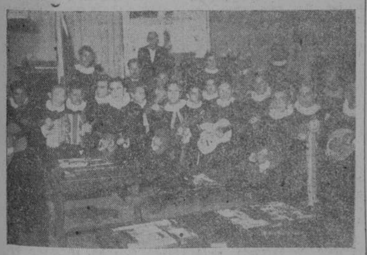
Como publicábamos en nuestro número del domingo, la Tuna Universitaria Salmantina visitó nuestro periódico de madrugada. Aparecen en la foto durante su actuación, con las planas del EL ADELANTO casi ajustadas, y al fondo, las máquinas y parte del personal del diario.