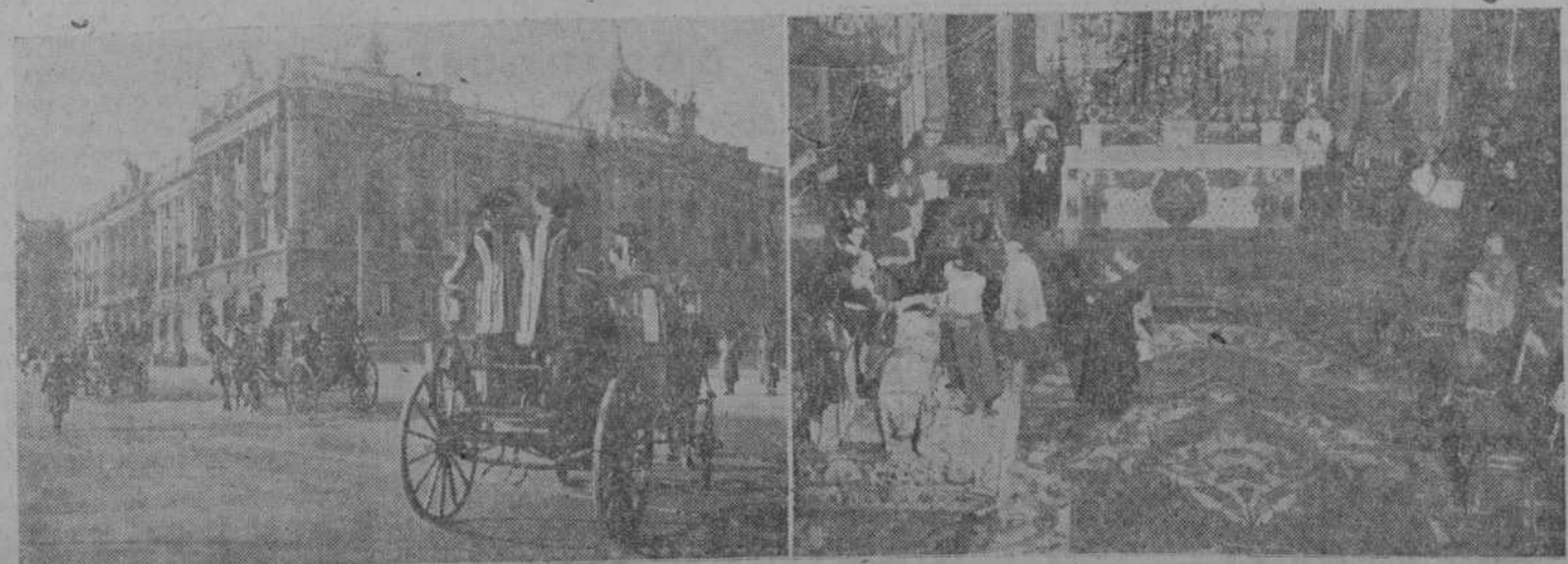
He aquí dos fotografías del solemne acto en que S. E. el Jefe del Estado impuso los birretes cardenalicios a los nuevos purpurados españoles y al Nuncio de Su Santidad. En una de ellas, las carrozas se dirigen al Palacio de Oriente, y en la otra, una perspectiva de la capilla del Palacio, durante la ceremonia