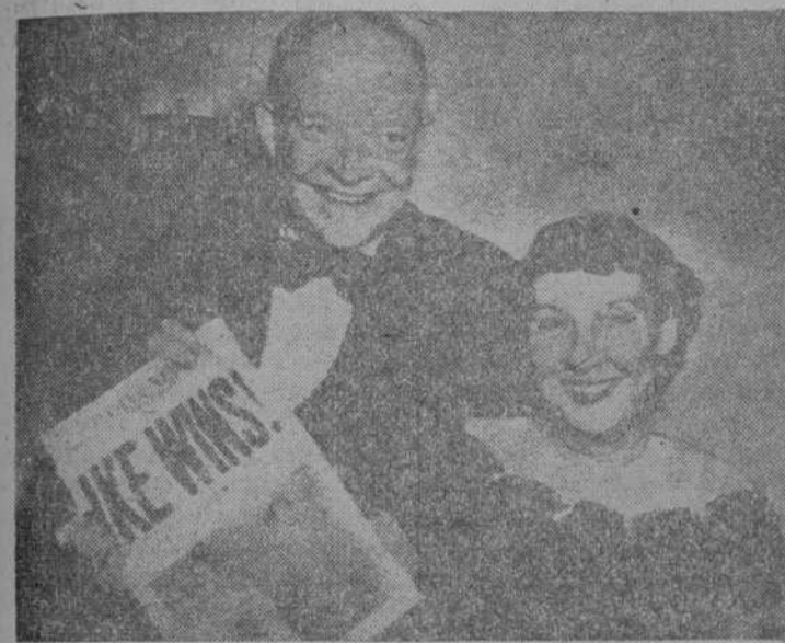
El general Eisenhower y su esposa con un periódico en el que se destaca el triunfo electoral del nuevo presidente

El nuevo presidente, a quien la multitud aclamó entusiásticamente, presenció un desfile, en el que figuraba, por primera vez, un cañón atómico