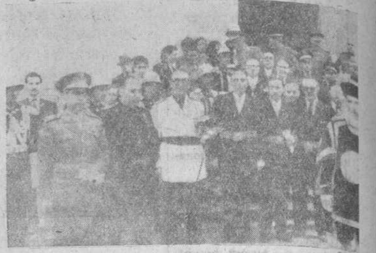
Las autoridades al salir de la misa solemne, de San Juan de Sahagun

Pese a que el comercio y la industria hicieron jornada normal por las circunstancias de este año, la ciudad adquirió ayer ese aire de fiesta, como en los días de la feria grande, para honrar a su Santo Patrono, San Juan de Sahagun. Desde la noche antes en que se celebró animada verbena en las inmediaciones de San Juan y no en el Pozo Amarillo como era tradicional, hubo música, cohetes y fiesta popular.