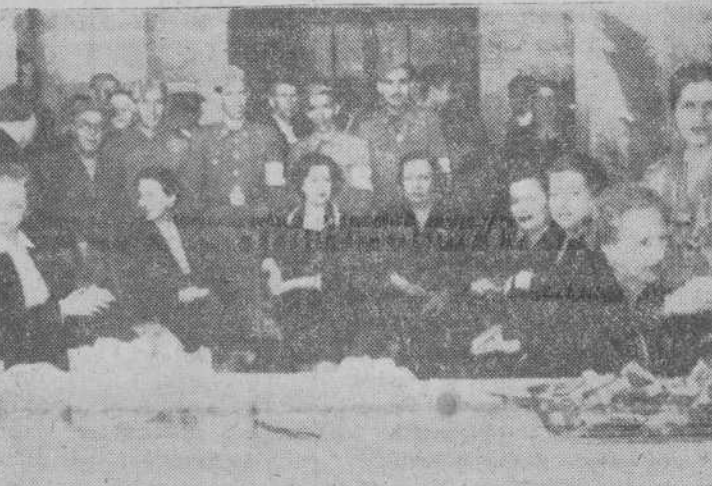
Mesa petitoria de la Cruz Roja, en la Plaza Mayor.

Coincidiendo con la festividad de San Juan de Sahagún, patrono de la ciudad, la Cruz Roja salmantina, Institución que tan beneméritos y abnegados servicios presta en la vida local, organizó para ayer, día 11, la Fiesta de la Banderita, que tradicionalmente se celebra cada año con el propósito de allegar fondos con los que hacer frente a los numerosos gastos de la asistencia social que en sus centros benéficos se presta diariamente.