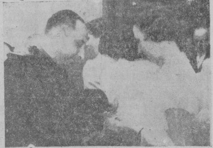
Una postulante recibe del señor gobernador el donativo por la banderita.

Se instalaron las mesas de costumbre en los lugares estratégicos de la ciudad, presididas por distinguidas damas de nuestra sociedad, que también se unieron al esfuerzo común en pro de la Cruz Roja salmantina, todo lo cual hizo que la finalidad de la fiesta quedara ampliamente rebasada por el éxito económico y el entusiasmo mostrado por el público.