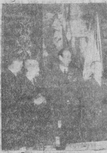
Presidencia de la recepción celebrada ayer en el Ayuntamiento