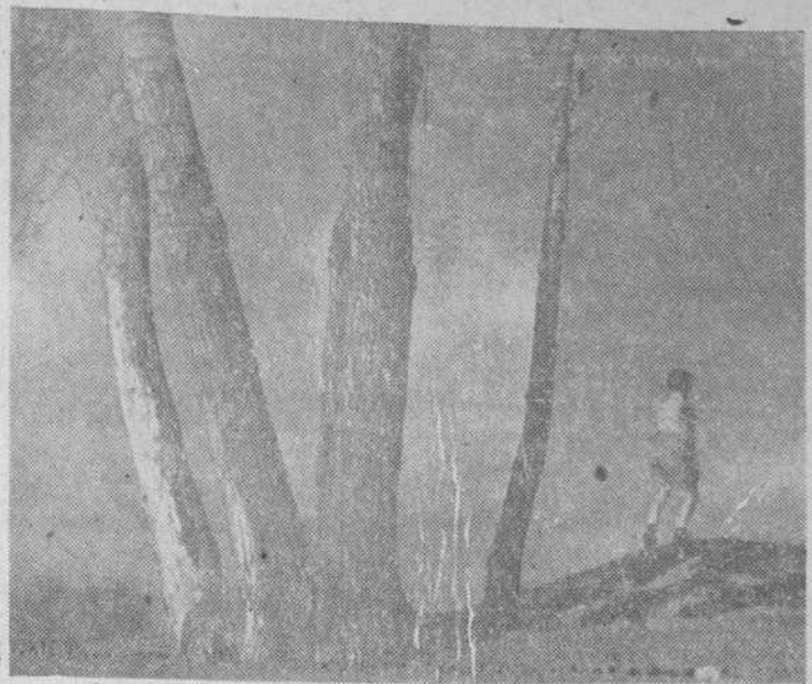
«Paisaje», de José Nuñez Larraz

En el otro aspecto, la exposición nos ofrece un gran interés, centrado en primer lugar, por ese entusiasmo que en su afición extraordinaria ponen estos dos buenos amigos. Sus obras—muchas de las expuestas—han logrado ya el triunfo destacado en Salamanca y fuera de nuestra ciudad; varias han sido galardoadas en certámenes de importancia. Y aunque ambos, para completar la colección expuesta, han usado de alguna obra