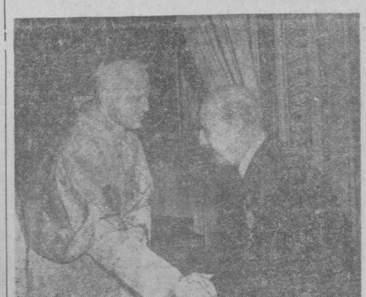
Su Excelencia el Jefe del Estado saluda al cardenal Tedeschini durante la visita que el Caudillo hizo al legado pontificio