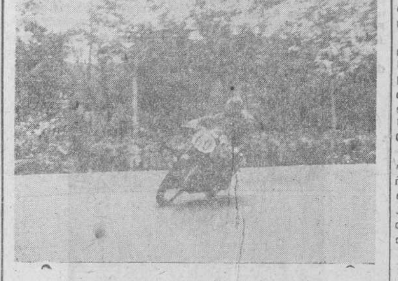
Ortueta durante su brillante actuación

«¿Os acordáis? Fue en aquellos que denominábamos "festivos" en el Stadium, cuando llegasteis a los 280 metros con un rudimentario material. Pues bien, amigos, de allí salió, burla, burlando, la posibilidad de salir el domingo maravillado del recinto universitario. Esto si que fué un "festivo" en toda la regla.