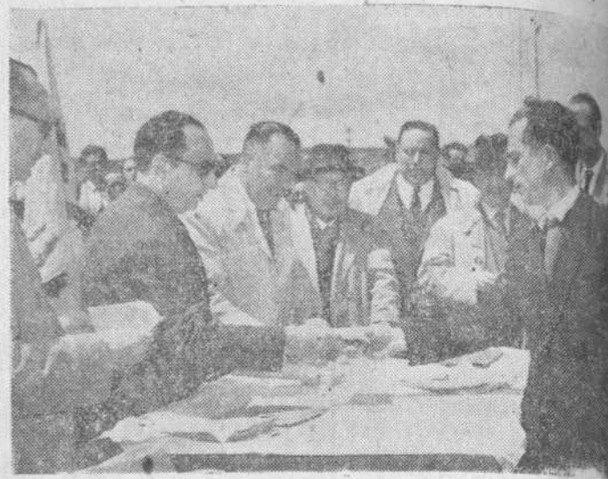
El gobernador civil, haciendo entrega de los premios

Segundo premio: al oficial de 1.º, Lorenzo Camaño San-