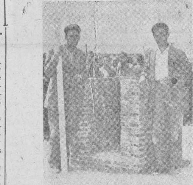
La obra que ganó el primer premio, con sus autores junto a ella

A los dos productores ganadores del Concurso Nacional se les costeará la carrera de aparejador.