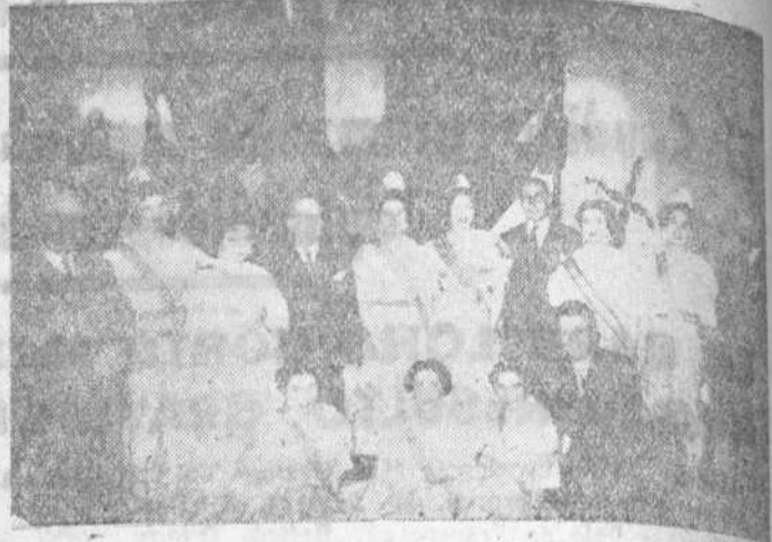
La corte de honor, acompañada de autoridades y directivos de la colonia

Simpática, magníficamente organizada y con elegancia, resultó la fiesta de la Colonia Estudiantil Valenciana de nuestra ciudad, que el domingo celebraron en honor de su Patrona Nuestra Señora de los Desamparados. Los jóvenes estudiantes valencianos supieron dar al programa de actos, todos los atractivos suficientes para que dejara un grato recuerdo. Primero la misa solemne bajo el marco magnífico de la Capilla de la Universidad Literaria, con la bendición de la imagen de la Virgen de los Desamparados, y después esa «dispará» de tracas y cohetes en la Plaza Mayor que fue casi un festejo popular del que participaron todos los salmantinos, para finalizar en la comida de confraternidad, en unión con las autoridades, madrina y damas de honor, y el baile de la tarde que con su animación puso brillante colofón a la fiesta.