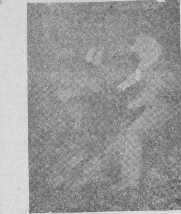
Labaryé llega al fondo de la gruta, entre las ruinas pétreas. Loubens le recibe a borbotos. La soledad en las cavernas es difícil de soportar incluso por los espeleólogos experimentados.

Labaryé, Loubens y Tazieff realizaron su exploración por el río subterráneo. Ese río