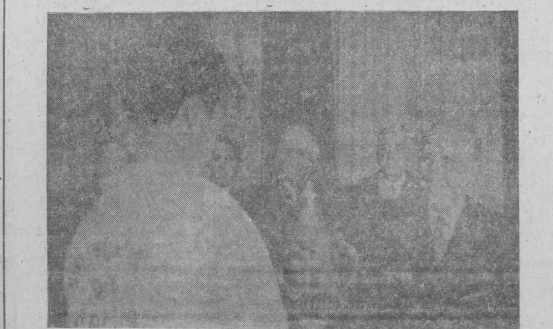
S. E. el jefe del Estado entregando la Copa Falanges del Mar, 1952, al capitán de la embarcación «Remeros del Nalón», vencedora en las pruebas recientemente celebradas en La Coruña, entre las que destacó la Regata Nacional de Bateles