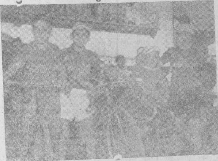
Equipo de Mototracción que tomó parte en las diversas pruebas