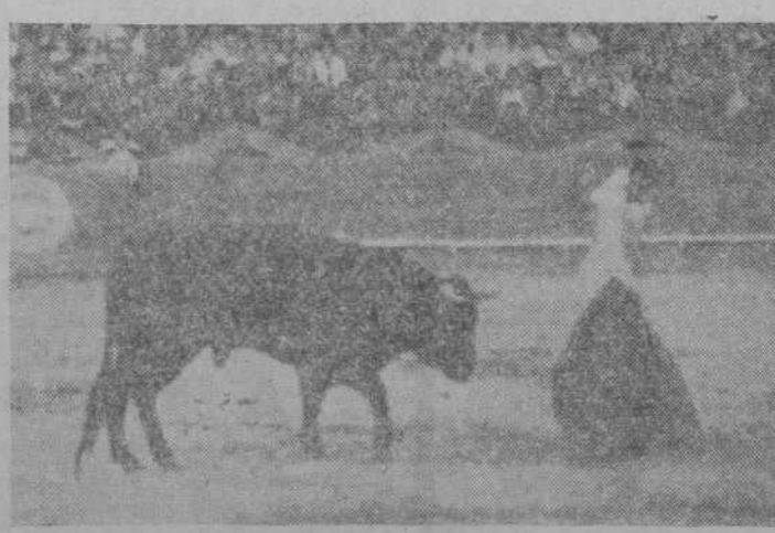
Jumillano iniciando uno de sus atorlados personalísimos.