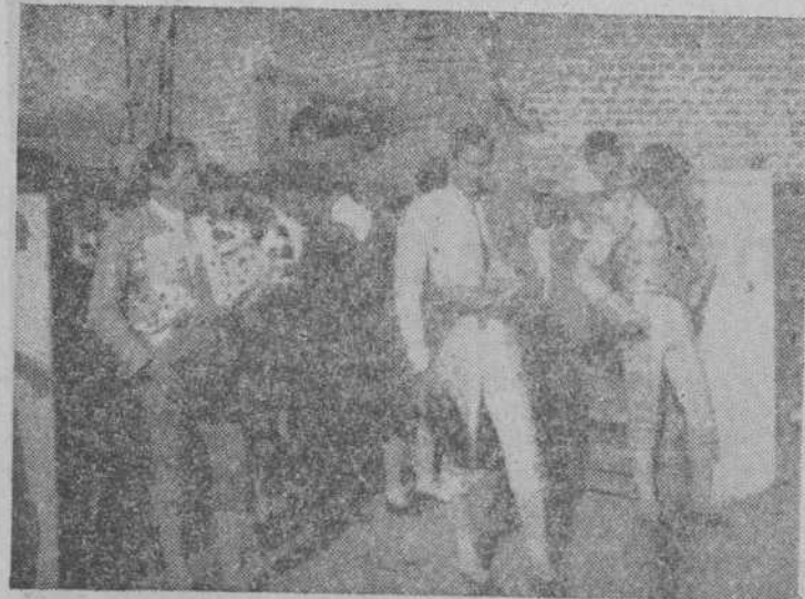
Los espadas dispuestos para el pastillo.

za e intenta saltar la barrera detrás de un peón. Calerito sale al encuentro del de don Alíicio y le para los pies con unos lances aceptables, en dos tandas. Cumple bien el "Pajarito" en las dos varas que toma y que dan ocasión a sendos quites de Calerito y Jumillano; aquí por chucuelinas y revolvera, y éste, por verónicas y revolvera también, que se aplauden. Con dos pares y medio de banderillas pasa el toro a manos de Calerito, que brinda desde el tercio. Empieza con dos muletazos por bajo, y luego de insistir mucho, porque el toro anda remolón para tomar el trapo rojo, da cuatro pases ayudados por alto. Citando de largo y llegando hasta la misma cara, dos derechazos, con desarme. (Música.)