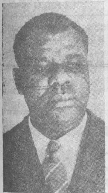
Mr. Deshield, ministro de Negocios de Liberia, que se encuentra en Madrid.

En realidad, los españoles tenemos una idea un tanto desahogada de la que es Liberia, no obstante estar a mitad del camino entre las Islas Canarias y nuestras posesiones del Golfo de Guinea. Pero si sabemos que es una nación de gran porvenir, poseedora de riquezas naturales trascendentes, de las cuales los europeos dis-