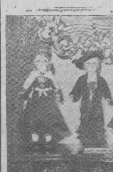
Un grupo de muñecas con los trajes salmantinos que se exhibe en el Certamen.

Madrid.—El presidente de las Cortes manifestó esta mañana a los periodistas que la sesión plenaria convocada para el jueves, día 18, dará comienzo a las once y media y probablemente será suspendida a las dos, con el fin de reanudarla a primeras horas de la tarde, ya que son muchos los asuntos a tratar que figuran en el orden del día. Añadió, que hasta el momento sabe que intervendrán en la sesión los ministros de Agricultura y Hacienda, y para defender los proyectos relativos a Justicia, los señores Conde, (don Agustín), Fernández, Hernando y Millar; para los de Agricultura, los señores