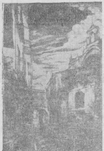
"El Corrillo", dibujo de Faustino Martín

su perfecta realización técnica y ese magnífico y bello dibujo de "El Corrillo".