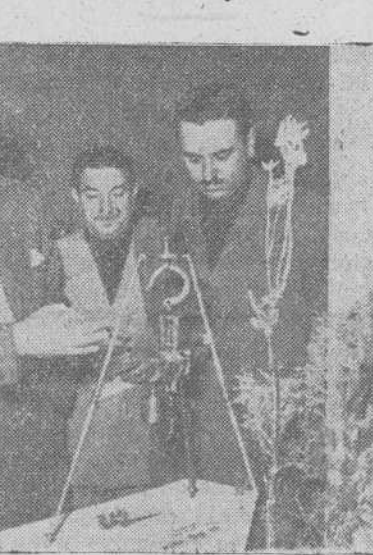
El señor Alcántara, jefe nacional de Artesanía, con el subjefe provincial del Movimiento, el delegado sindical y otras jerarquías, visitando la Exposición.

gran variedad de actividades artesanas, tales como filigrana charra, forja, electricidad, carpintería, hojalatería, esmaltado, talla en madera, tejidos, bordados, trajes típicos, alfombras, trabajos de encuadernación, zapatería, alfarería, y otras variedades. Destacan en la Exposición, no solamente los trabajos típicos y tradicionales, sino también la artesanía que pudiéramos llamar "modernista", especialmente en objetos de adorno, realizándose también muchos trabajos de miniaturas de trajes charros, filigranas en diversos estilos antiguos y modernos, y riquísimos modelos de joyas charras, magníficas alfombras, y objetos propios de aplicaciones agrícolas y caseras en el medio rural. La Exposición estará abierta hasta el próximo día 21, y ha de merecer el elogio de cuantos desfilen por ella.