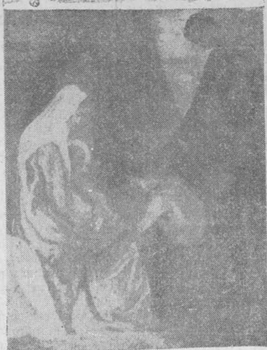
"Adoración de los Pastores", óleo de Fernando Mayoral

Esta, la titulada "Adoración de los pastores", constituye el exponente de una idea largamente trabajada y amorosamente abordada. Pero el resultado debe ser atentamente meditado por su autor para sacar las debidas consecuencias, que le sirvan de pauta en empeños futuros.